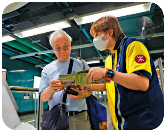
▲港鐵職員向長者講解「兩蚊兩折」乘車計劃。