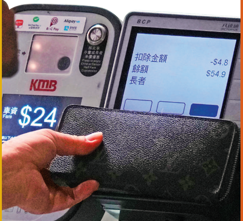
▲新機制下長者乘搭長途巴士，需支付成人票價兩折車費。