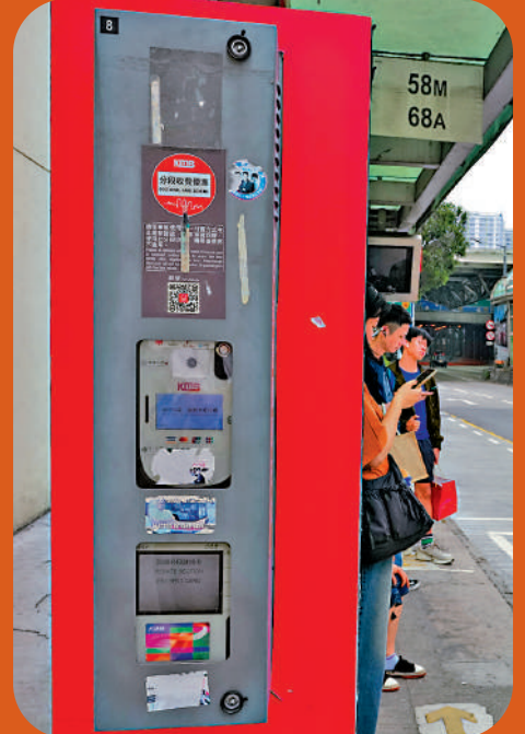
▲部分巴士路線設有短途分段收費安排，乘客下車後拍卡，可獲車費回贈。