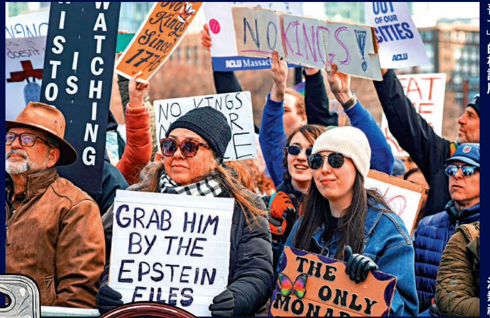
▲3月28日，在波士頓舉行的「不要國王」抗議活動中，示威者手持寫著「用愛潑斯坦檔案逮捕他」(特朗普)的標語牌。

【大公報訊】特朗普2日在社交媒體發帖，宣佈解僱司法部長邦迪，她將轉任私營部門工作。司法部副部長布蘭奇將代理司法部長一職。邦迪隨後發表聲明表示，將在未來一個月與布蘭奇完成工作交接，並稱將在新崗位上「繼續為特朗普及其政府奮戰」，但未透露具體職務。