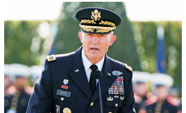
▲美國陸軍參謀長喬治去年9月在五角大樓發表講話。

海格塞斯去年宣布結束國防部的「覺醒文化」，並公開指責軍方在晉升中優先考慮多樣性而非能力。