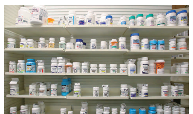
▲美國猶他州一家藥店內貨架上擺滿了各種藥品。

者承擔。今年2月20日，最高法院裁定特朗普依據《國際緊急經濟權力法》(IEEPA)所徵收的「對等關稅」非法後，特朗普政府隨後根據《1974年貿易法》第122條向全球進口商品徵收10%臨時關稅，為期150天。至於最高法院下令當局退還1660億美元的稅款連同利息，美國當局據稱正在設立退款平台，最快4月底正式上線，但商家和民眾要拿到退款仍遙遙無期。