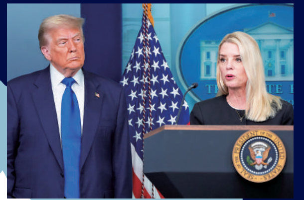
▲美國司法部長邦迪(右)與總統特朗普在白宮簡報室發表講話。