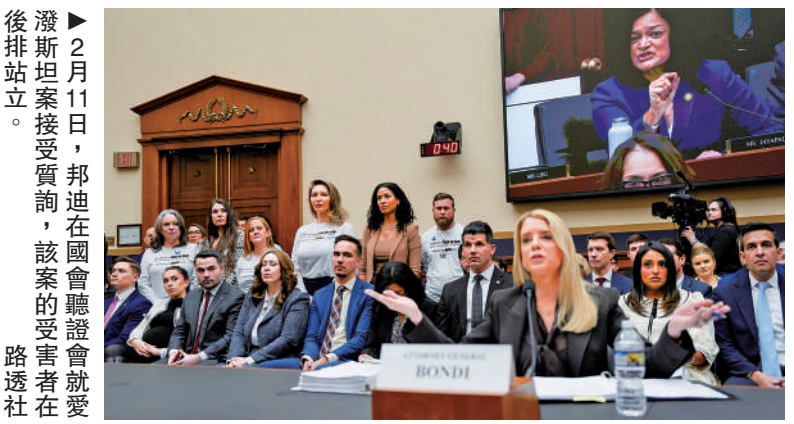
▲2月11日，邦迪在國會聽證會就愛潑斯坦案接受質詢，該案的受害者及後排站立。

隨著11月中期選舉臨近，最新民調顯示，特朗普支持率降至重返白宮以來最低，伊戰戰爭推高油價通脹和移民執法爭議等問題，讓共和黨在關鍵選區面臨巨大壓力。一名資深政府官員表示，這一輪可能的高層調整主要針對特朗普認為「表現不佳或引發過多負面關注」的內閣成員。例如，撤換盧特尼克或有助於特朗普對外傳達「我正在對經濟做出調整」的信號。(綜合報導)