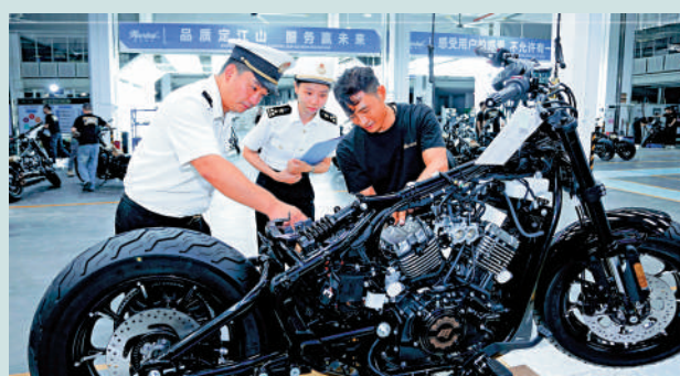
▲廣東江門的摩托車迎來出口「開門紅」。圖為海關關員到轄區摩托車企業進行實地監管。

廣州市商務局介紹，年產量約64.2萬台的五羊-本田摩托、年產73萬台的豪進摩托，兩家企業貢獻廣州50%的摩托車產量，成為產業發展「壓艙石」；廣州大運摩托2025年工業總產值按年增長超60%，產品熱銷非洲，還成功開拓了南美市場。目前，廣州摩托車產品已出口200多個國家和地區。