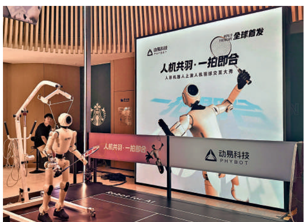
▲廣東製造的機器人出海越來越火熱。圖為一款機器人正在測試中。