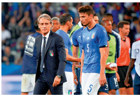
▲文仙尼（左一）曾執教意大利國家隊。

【大公報訊】隨着意大利無緣2026年世界盃決賽周，主帥加度素已正式卸任。這支褪色的歐洲傳統勁旅，正積極物色新任教頭。據報目前有三名熱門人選，分別是干地、艾歷利及文仙尼，不過三人均有職務在身：干地執教拿波里，艾歷利掌舵AC米蘭，文仙尼則任教卡塔爾球會艾薩德。對於新帥人選，意大利名宿維拉強烈反對文仙尼回巢。他認為對方當初捨棄意大利國家隊遠赴沙特阿拉伯，已作出了明確的選擇，如今「沒有人希望他回來」。