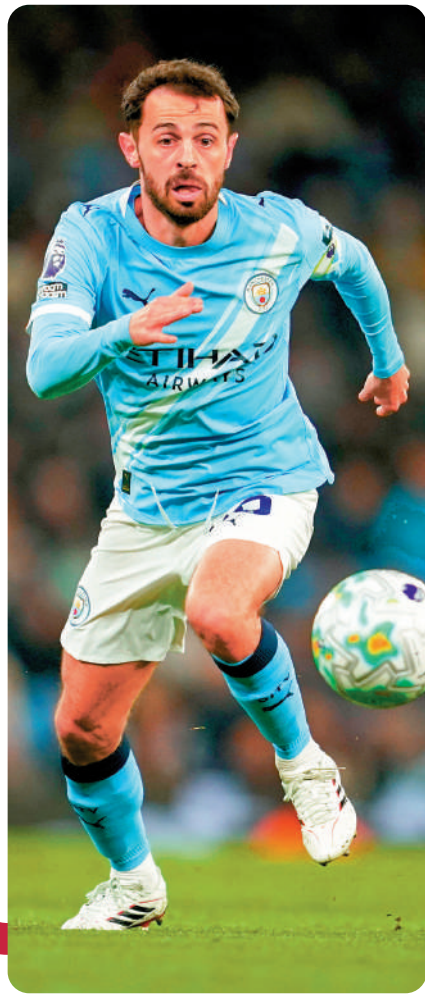
▼曼城中場貝拿度施華。