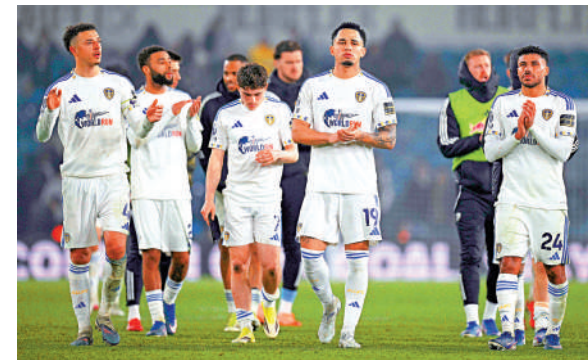
▲列斯聯今季英超16次作客僅取1勝。

護級戰之中，同樣無法分心在英足盃爭取錦標。尤其列斯聯在英超16場客戰中僅得1勝，難以想像球隊能在作客取得佳績。加上雙方近3次對賽成績為勝、和、負各一，實力不相伯仲，今仗和味甚濃，主客和盤口的「和」值博率不俗。