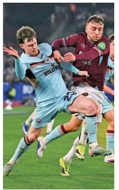
▲韋斯咸前鋒查洛保雲（右）。