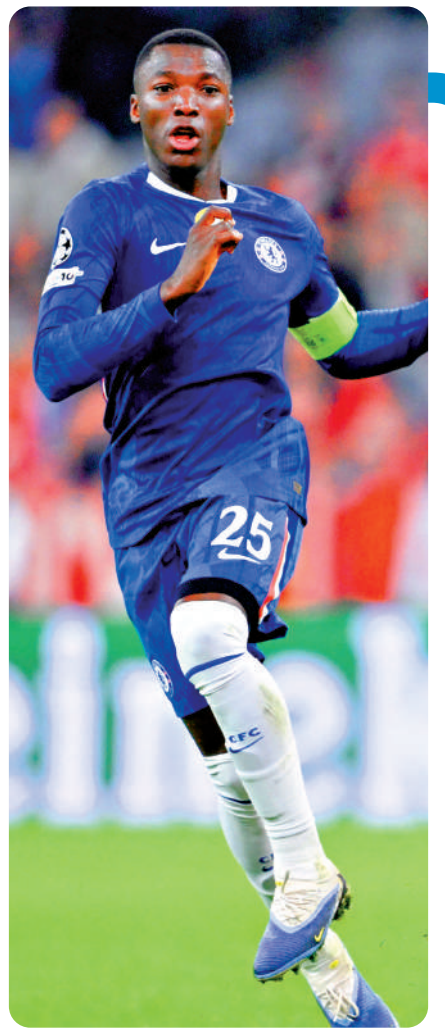
▲車路士中場摩西斯卡斯度。