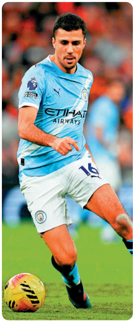
▲曼城中場洛迪卡斯簡迪。