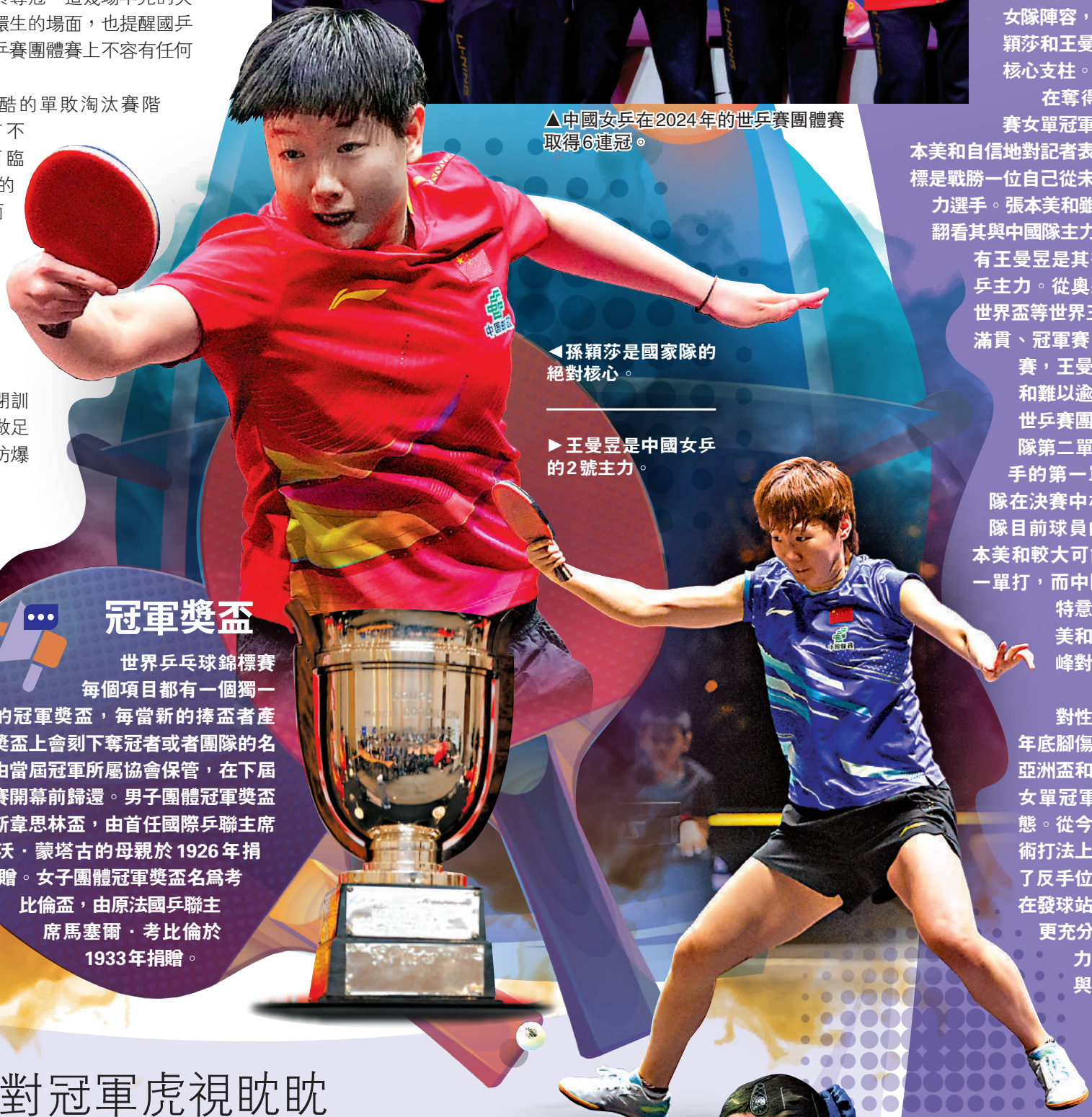
▲孫穎莎是國家隊的絕對核心。