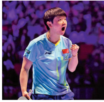
▲孫穎莎在比賽中慶祝得分。