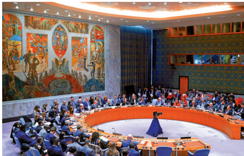
▲從推動發展議題重回國際議程中心，到新興技術等領域倡導規則共建，中國為破解全球治理困境提供可行現實路徑。圖為聯合國安理會圍繞「改革完善全球治理」舉行高級別會議。新華社

中東不穩，天下難安。美以伊戰事持續延宕之際，地區國家與國際社會要求停火止戰的呼聲越發強烈。緊要關頭，作為負責任大國，中國持續密集開展斡旋工作，為推動緊張局勢降溫作出積極努力。