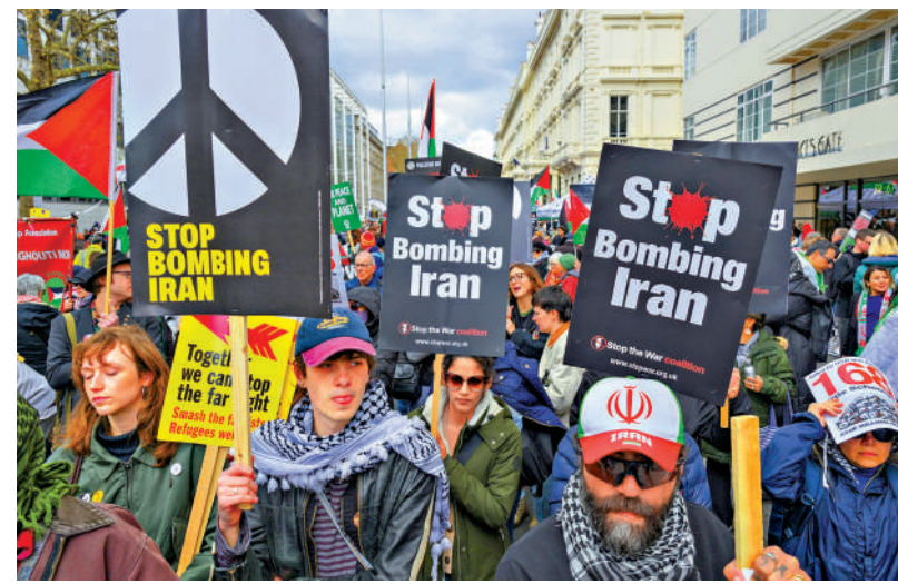
▲美國無視國際社會強烈反對，悍然對伊朗動武。大批示威者日前在倫敦集會，抗議美以對伊朗發動軍事打擊。

美國退出31個聯合國實體和35個非聯合國組織，合計66個國際組織，在全球治理中處更脆弱位置。