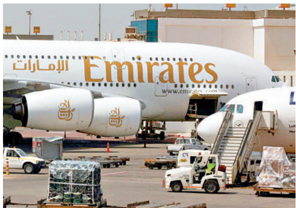
▲阿聯酋航空公司的飛機停靠在埃及開羅國際機場。

專家警告，航油價格可能會進一步上漲。歐洲航空公司擔憂供應短缺，高級主管們幾乎每天在監測燃料供應情況，大概只能掌握4至6周內的狀況。