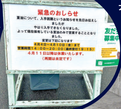
▲日本一家溫泉店外貼出「緊急告示」，該店因重油短缺，將於4月11日起停業。

日本11%的液化天然氣進口自中東，但日本只擁有約3周的天氣儲備，極易受短期供應中斷和全球天然氣價格波動影響。