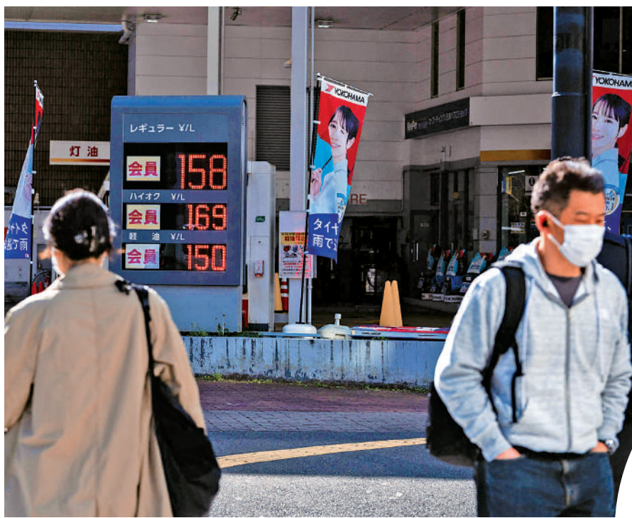
▲日本民眾路過東京一個加油站。

受中東局勢持續影響，日本多個行業因燃料短缺和價格飆升遭受重創。日本原油進口量驟降，導致由原油加工所得的重油供應嚴重緊張，對依賴重油加熱溫泉水的日本溫泉業造成致命打擊。日媒近日報道，多地溫泉和洗浴設施已被迫停業，另有不少通過縮短營業時間降低成本。運輸行業和食品行業也面臨嚴峻的成本壓力。