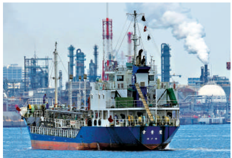
▲東京南部川崎濱工業區，一艘小型油輪在煉油廠附近航行。

岐阜縣知名溫泉池田溫泉於4月3日正式宣布停業。這家溫泉以觸感光滑的天然溫泉水著稱，每月約有1萬名顧客光臨。