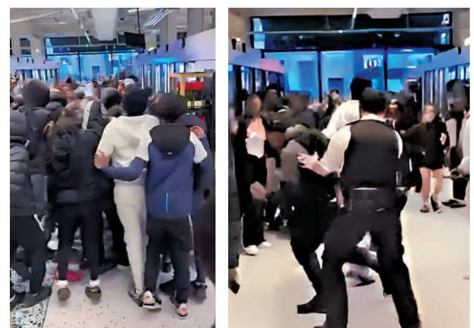
▲社交媒體視頻顯示，數百名青少年在馬莎百貨店內互相推搡，搶劫商品。

英國國家統計局最新數據顯示，截至2025年9月的一年中，英格蘭和威爾士共發生51.9萬起商店盜竊案，較上年上升了5%。