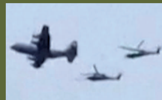
▲ 視頻截圖顯示，美軍加油機和兩架直升機飛越伊朗南部上空，據稱在搜索F-15E戰機的機師。 法新社