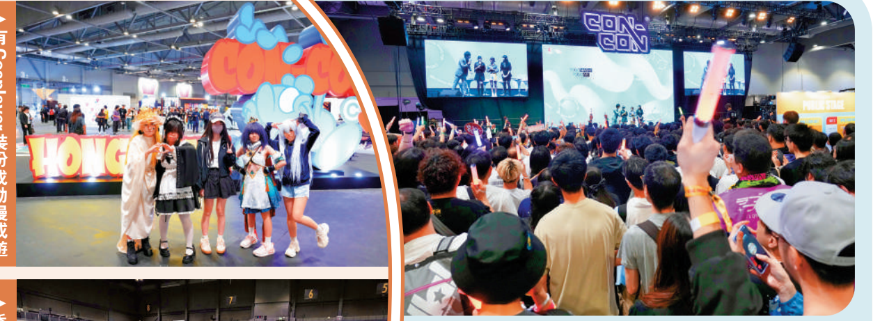
▲「CON-CON HONG KONG 2026」昨日在亞博館舉辦，現場人山人海。