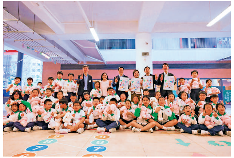
▲截至上月，在校課後託管服務計劃已有逾200間小學參加，提供超過10500個名額。