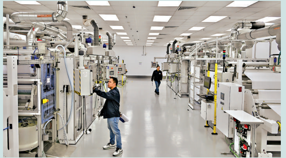
▲本港將推出「新型工業菁英企業培育計劃」，是踏出再工業化的重要一步。