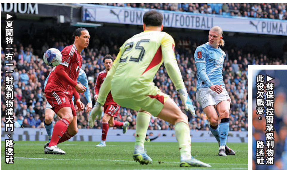
▲夏蘭特（右二）射破利物浦大門。