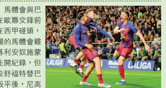
▲羅拔利雲度夫斯基（右一）入球後慶祝。