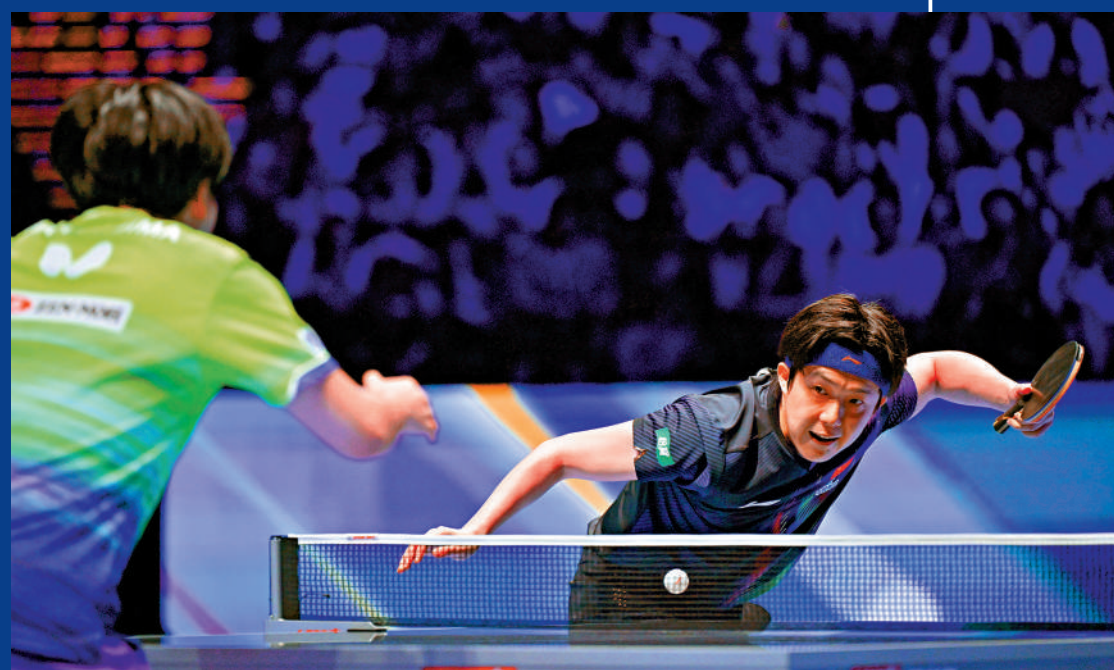
▲王楚欽在比賽中發球。

回顧整個賽事，孫穎莎表示收穫豐富，她認為透過這幾天的賽事，每天的起伏處理、身體和心理狀態的調整，都讓她感覺到有所進步，這些積累對她而言是非常寶貴的財富。談及接下來的計劃，孫穎莎表示希望先好好整理這次比賽的得失，同時充分休息，她會全力以赴，爭取稍後在倫敦的世乒賽中同樣有出色表現。