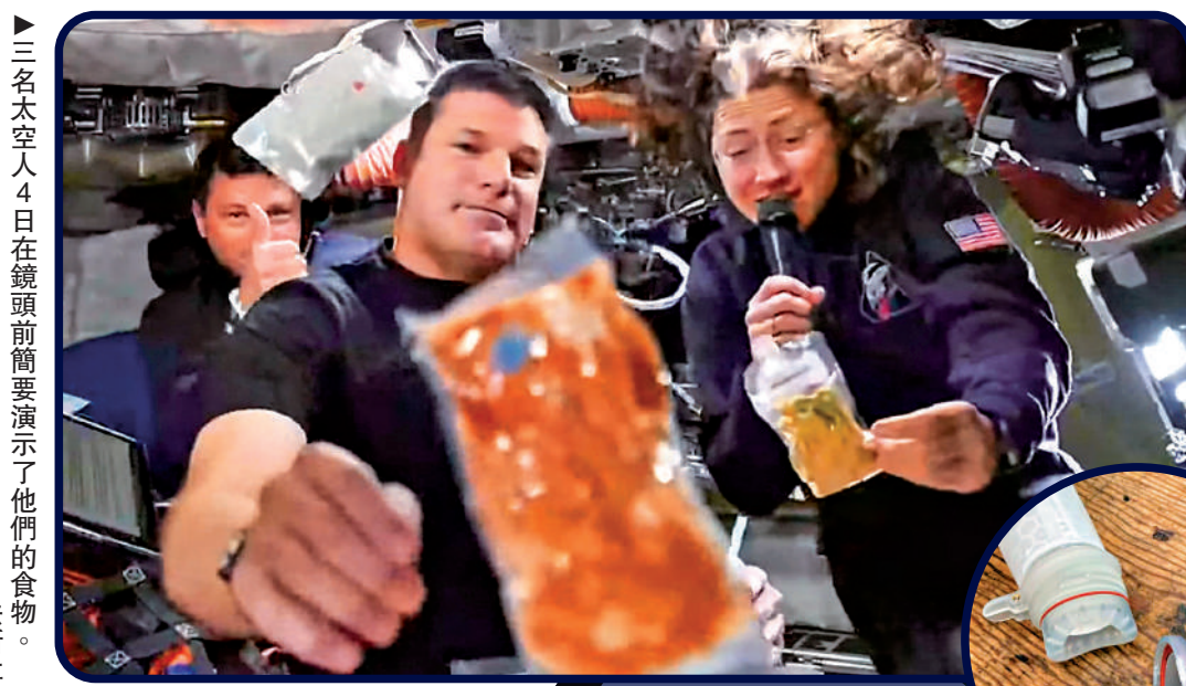
三名太空人4日在鏡頭前簡要演了他們的食物。