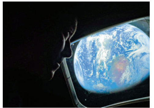
▲NASA傳回首批在「獵戶座」太空飛船上拍攝的地球照片。

在2026年的美國，能把人們團結在一起的事物少之又少。美國民眾對總統、國會、法院、企業、警察和媒體的信任度正在下降。《紐約時報》評論稱，「如今的美國似乎難以實現團結，而領導它的總統也幾乎無意推動團結。」