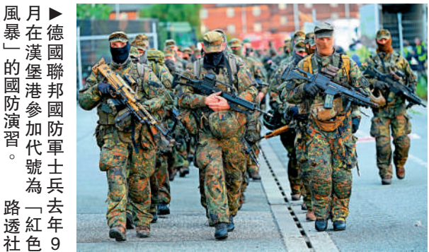
▲德國聯邦國防軍士兵去年9月在漢堡港參加代號為「紅線」的國防演習。

據報道，德國《兵役現代化法》今年年初生效，但在德媒4日報道此事前，這項規定基本上沒有引起民眾注意。德國國防部表示，17至45歲男性旅居國外3個月以上需軍方批准，這項規定是為了建立可靠、有