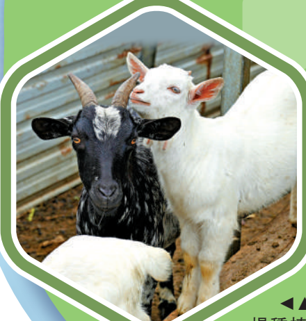
▲農場種植逾40款蔬果，包括士多啤梨、生菜，供市民採摘；場內又飼養羊群。