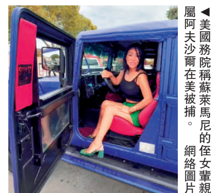
◀ 美國務院稱蘇萊馬尼的侄女輩親屬阿夫沙爾在美被捕。

屬在美國居住。2020年1月，特朗普首次出任美國總統期間，蘇萊馬尼在伊拉克首都巴格達國際機場遭美軍空襲身亡，導致美伊關係進一步惡化。