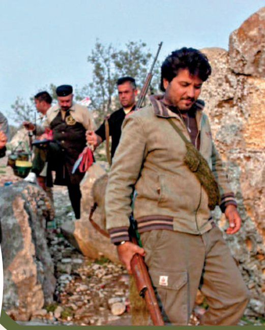
▶ 伊朗媒體5日公布參與營救行動的美軍飛機殘骸照片。