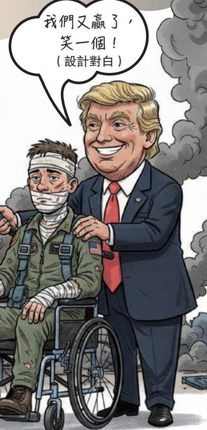
大公報 AI 製圖