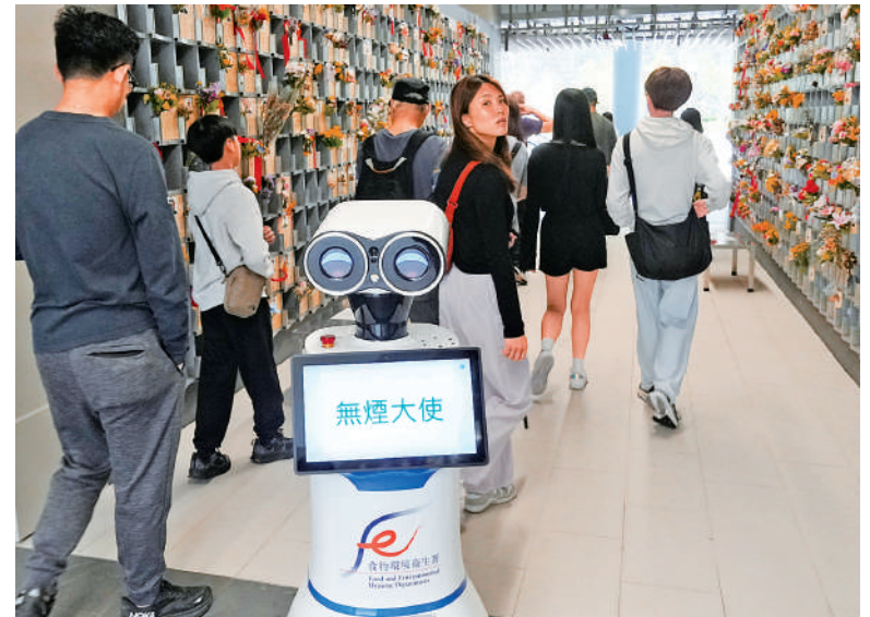
石門靈灰安置所 ▲在石門靈灰安置所，機械人在場內不斷巡邏，提醒市民不要點燃香燭或燒衣。