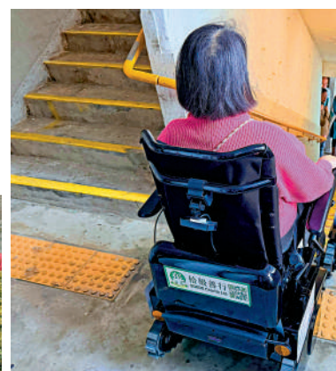
▲房署表示，預計今年第二季先購入兩至三部「樓梯機」於友愛邨試用。