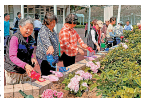
▲房委會期望透過提升長者生活質素。 康榮傑又指，去年底起，新物業管理合約要求承辦商參與社署的「與照顧者同行」計劃，安排最少20%的前線員工接受長者關懷培訓，包括物業管理主任和保安員，以主動識別需要幫助的長

康榮傑又指，去年底起，新物業管理合約要求承辦商參與社署的「與照顧者同行」計劃，安排最少20%的前線員工接受長者關懷培訓，包括物業管理主任和保安員，以主動識別需要幫助的長