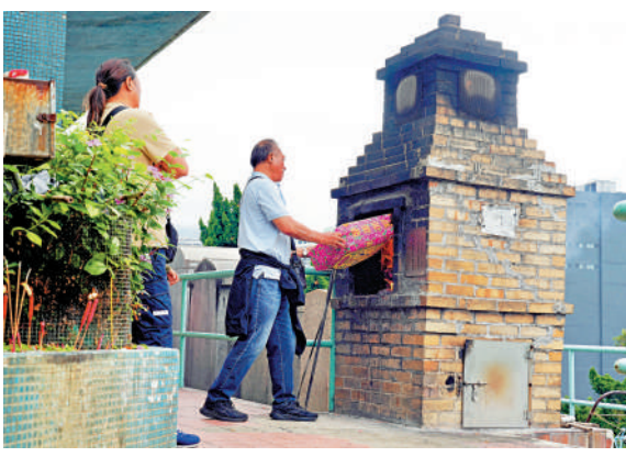
荃灣華人永遠墳場 ▲食環署表示，目前並無計劃以「無煙祭拜」取代傳統燒香祭拜。