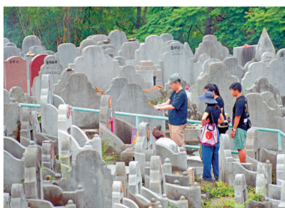
鑽石山墳場 ▲在鑽石山墳場，大批孝子賢孫冒雨到場拜祭。

食物環境衛生署表示，燃燒冥錢是香港市民的传统習俗，目前並無計劃以「無煙祭拜」取代傳統燒香祭拜，但過程難免造成空氣污染及碳排放。因此署方近年已陸續設置多個特色悼念設施，包括曾咀的「渡船」、石門的「靜念池」，以及和合石的「泉愛」，為市民提供不同的祭拜方式，並鼓勵市民在掃墓期間，採用鮮花貢品、無煙香燭等更環保的方式，向先人表達懷念與感恩。