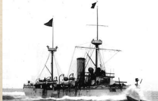
▲進行高速試航時的「致遠」新式巡洋艦。

類型：新式巡洋艦（與致遠同批） 建造：英國，紐卡斯爾 時間：1885年訂造，1887年完工交付 服役：1887年接收，加入北洋艦隊 關鍵事件：1895年威海灣戰鬥中隕落