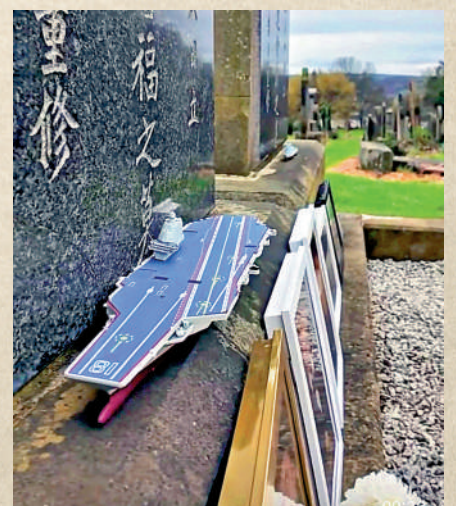
▲參加祭掃人士在墓碑前放著中國航母模型，告慰長眠英國的北洋水師水兵。