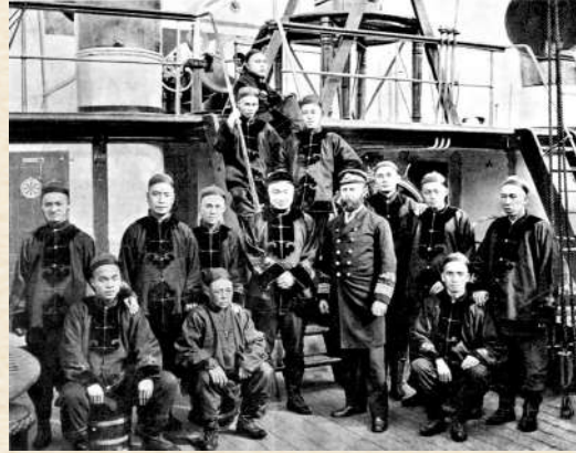
▲北洋水師「致遠」新式巡洋艦軍官合影。

類型：撞擊巡洋艦 建造：阿莫斯特朗公司，紐卡斯爾 時間：1880年開工，1881年8月完工交付 服役：與超勇號一同於1881年接收，編入北洋艦隊 關鍵事件：黃海大海戰（1894年9月17日）中犧牲