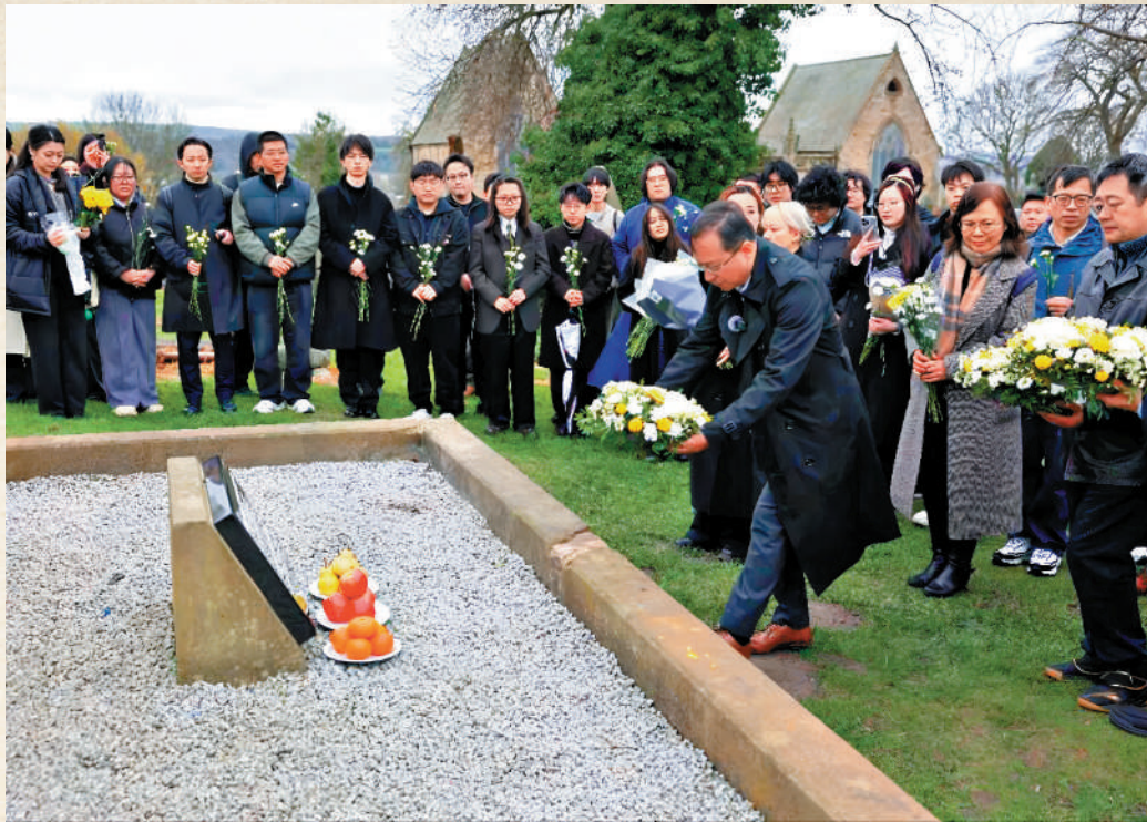
▲4月4日清明節前夕，中國駐曼徹斯特總領事唐銳赴英國紐卡斯爾拜謁北洋水師水兵墓。英國北洋水師遺存保護基金會會長戚勇強、當地華社和留學生代表百餘人參加，獻上鮮花寄哀思祭忠魂。