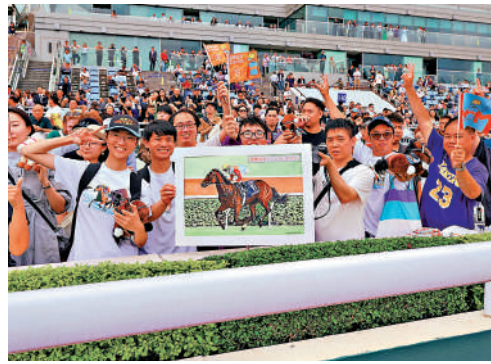
▲馬迷入場支持「嘉應高昇」。

【大公報訊】香港馬王「嘉應高昇」6日在沙田馬場出戰二級賽千二米短途錦標，在最後直路以雷霆萬鈞姿態大勝對手掄元，