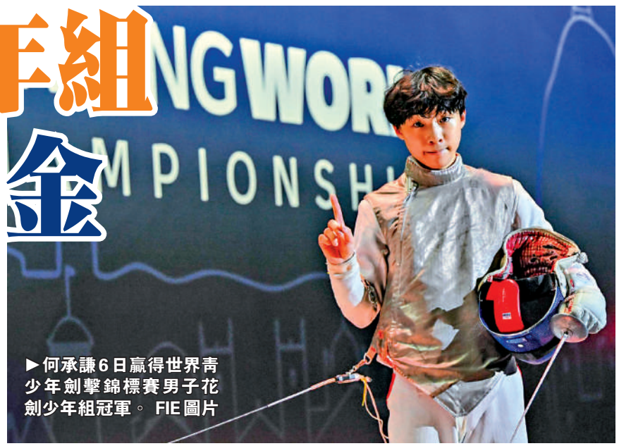
▶何承謙6日贏得世界青少年劍擊錦標賽男子花劍少年組冠軍。