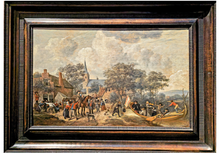
▲揚·斯蒂恩繪製的《愚人船》。

身為十七世紀荷蘭共和國首屈一指的風俗畫家，揚·斯蒂恩完全繼承了從希臘尼德蘭·博世(Hieronymus Bosch)到老彼得·勃魯蓋爾(Pieter Bruegel the Elder)等尼德蘭前輩畫中諷刺和諷刺的元素。尤其是後者身為西方風俗畫先驅之一，對斯蒂恩將民間寓言和諺語與現實社會氛圍相結合的創作風格起到了重要影響。他將《愚人船》的場景選在了一個尼德蘭村鎮中，並巧妙地用建築將畫作一分为二，天空中的雲卷雲舒與前景村中的人頭攢動形成鮮明的疏密對比。遠景右側淡藍色的平緩山巒為畫作提供了透視縱深，而喧鬧的村鎮中心似乎正在慶祝節日，最左側一群男女手拉手圍成一圈載歌載舞，一位風笛手正在為他們伴奏。前景的馬背上一位紳士正在高舉酒杯暢飲，和他身側的紅衣男女似乎一起在向最右側的船隻致意。當我們將目光隨着紅衣男子揚起左手的方向望去，坐在船正中央身穿灰袍、左手持煙斗右手扶帽簷的紳士應是在向他們還禮。相較於岸上的人群，船上八位乘客的肢體語言顯然更加豐富。有正襟危坐的、有拉琴助興的、有釣魚上鉤的、有臥船嘔吐的……上述看似無厘頭的畫面細節，實則和《愚人船》概念的出處有關。