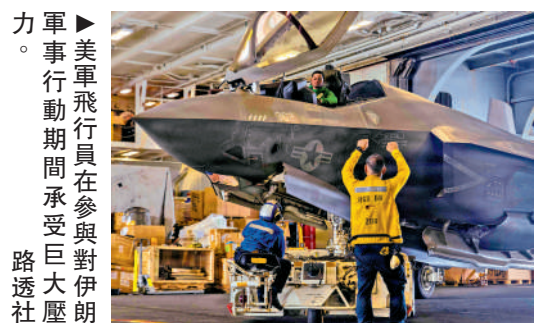
▲美軍飛行員在參與對伊朗軍事行動期間承受巨大壓力。

美軍B-1B和B-52轟炸機來說，如果穿過法國、意大利和希臘領空，再飛越地中海前往作戰地點，往返僅需10個半小時，過程中需完成4次空中加油；但由於法意等國對美軍戰機設限，美軍只能繞道，飛行時間延長至18個小時，要求飛行員進行精細操作的空中加油次數也增至8次。英媒披露，美軍飛行員依靠中樞神經興奮劑莫達非尼片保持清醒。這種藥物原本主要用於治療嗜睡症，濫用會導致上癮，並引發焦慮和抑鬱等症狀。