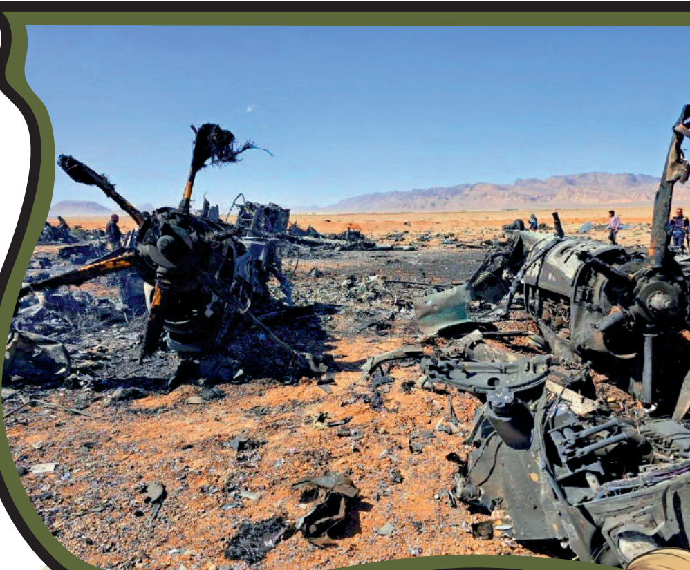
▲伊朗5日發布進入伊朗境內營救飛行員的美軍飛機殘骸照片。