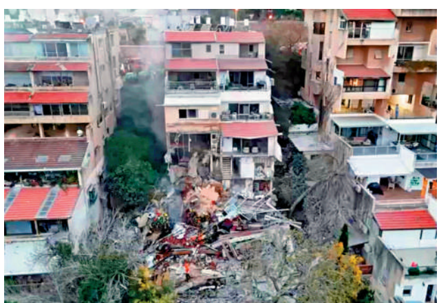
▲以色列海法地區5日遭伊朗打擊。

伊朗革命衛隊6日宣布對以色列特拉維夫、海法等地發動新一輪打擊，並襲擊了一艘美軍兩棲攻擊艦，迫使其後撤至印度洋南部。