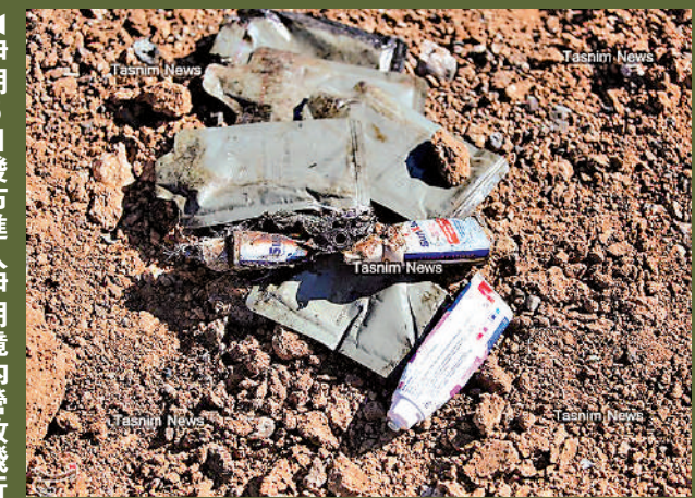
▲伊朗媒體發布據稱是美軍遺留物資的照片。