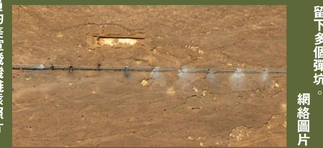
▲美軍營救飛行員期間在伊朗境內實施空襲，留下多個彈坑。