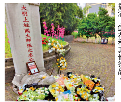
擺滿了鮮花和其他祭品。

正研讀歷史，再以當代物品與話語完成跨時空關懷，將「聖人」拉下神壇，讓歷史擺脫課本死文字的刻板，成為有溫度的生命故事，同時也契合綠色環保的文明祭掃趨勢。