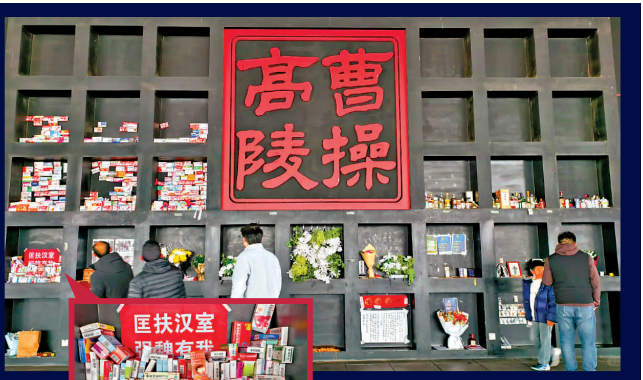
曹操墓 ▲清明假期期間，河南安陽曹操高陵遺址博物館內，一處特殊的「供品櫃」意外走紅社交平台，裏面擺放着許多盒布洛芬。