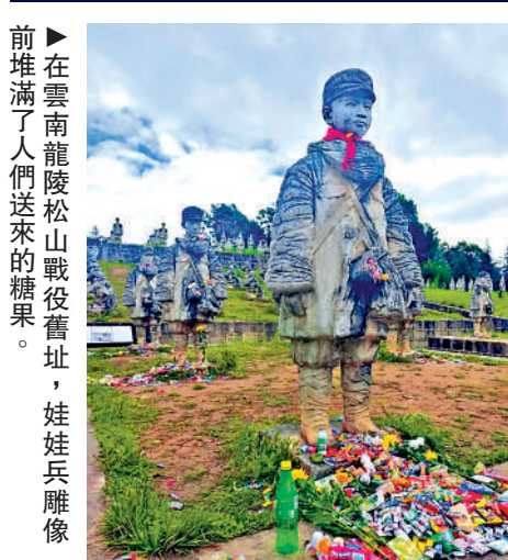
前堆滿了人們送來的糖果。