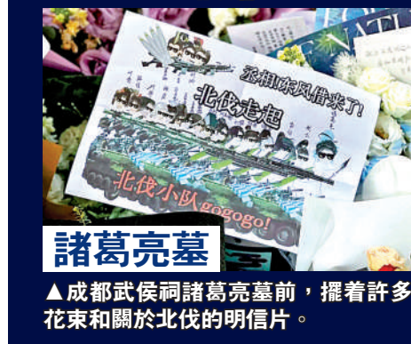
諸葛亮墓 ▲成都武侯祠諸葛亮墓前，擺着許多花束和關於北伐的明信片。