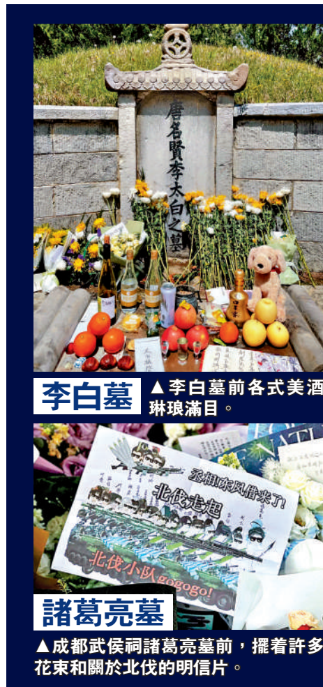
李白墓 ▲李白墓前各式美酒琳琅滿目。

事實上，曹操墓前的「布洛芬奇觀」並非個例。記者梳理發現，近年來內地年輕人祭掃歷史名人墓時，頻頻出現「花式祭品」，用當下的生活方式，與千年前的歷史人物展開趣味對話。據報道，明代張居正墓前，最特別的供品是馬應龍痔瘡膏，只因野史記載，張居正因痔瘡手術元氣大傷而離世；西漢霍去病墓前，薯片、辣條常年不斷，皆因這位少年將軍年僅23歲便英年早逝，當代大學生感同身受，以年輕人喜愛的零食，致敬這位同齡的民族英雄；北魏孝文帝拓跋宏墓前，更是掛着「漢化大使」錦旗和「最佳漢化組」獎狀，以此嘉獎他身為鮮卑族皇帝，力主推行漢化改革、促進民族融合的歷史功績。