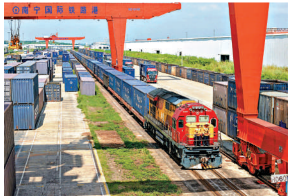
▲裝滿出口貨物的中越班列駛出廣西南寧國際鐵路港。

當前，國際供應鏈發展中存在的脫鈎斷鏈問題，某些國家在破壞國際供應鏈秩序中也在反噬自身供應鏈安全。楊達卿認為，「國際供應鏈最大的不安全風險來自互利共贏原則失守，沒有規則的，沒有互利的國際供應鏈才是最不安全的供應鏈。守住了基本原則，其他的不安全都可以協商解決。」