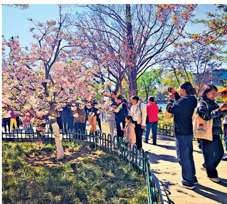
▲2026年內地清明假期，遊客在北京玉淵潭公園踏青賞花。

另據文旅部介紹，這個假期，烈士陵園、紀念場館、紅色旅遊景點迎來祭掃高峰。此外，賞花踏青與文旅消費深度融合，推動春日經濟向體驗式轉型。各地打造花園城市、郊野公園等優質空間，拓展消費場景。天津舉辦五大道海棠花節，重慶開展200餘項春季文旅消費活動，陝西推出159項文旅惠民措施等，推動賞花經濟與國風、夜遊、文創等創新融合。假期演唱會、音樂節集中舉辦，帶動周邊文旅消費升溫。