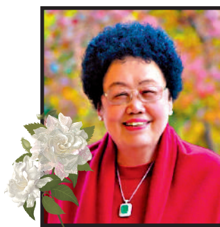
布斯中國富豪榜上長期唯一穩定上榜的中國女富豪。20世紀80年代，陳麗華赴香港發展並創立富華國際集團，目前集團支柱產業涵蓋地產開發及運營管理、文化藝術、大健康等領域。1986年，在時任全國政協主席

公開資料顯示，陳麗華1941年4月出生於北京，曾任第八至十二屆全國政協委員、第十一及十二屆全國政協港澳台僑委員會副主任，是早年福