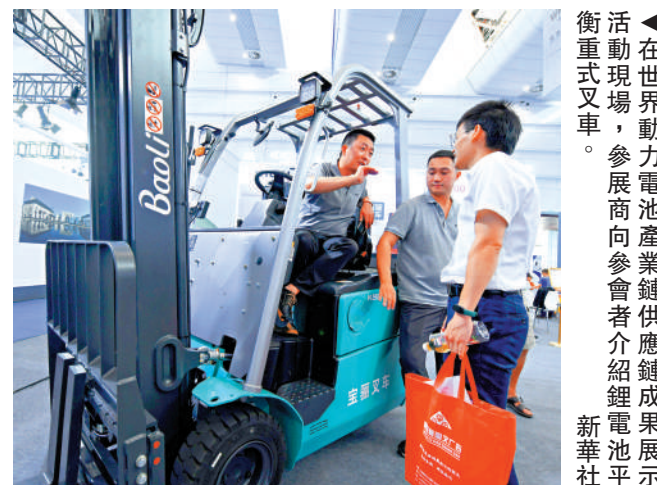
▲在世界動力電池產業鏈供應鏈成果展示活動現場，參展商向參觀者介紹鋰電池平衡重叉車。

他進一步指出，產業鏈供應鏈是全球化協同的產物，追求的不再是環節優化或區域優化，而是追