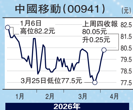
▲中移動不單息率吸引，業務不受外圍及經濟周期影響，明顯具備防守性。

中國移動 (00941) 買入價：現價 目標價：84至85元 止蝕價：77元 評論：大市已擺脫反覆尋底的弱勢形態，但預計走勢仍然反覆，目前入市不宜過分進取。中移動明顯具備防守性，股價已重返80元以上，由於其業務不受外圍及經濟周期影響，目前市盈率合理，加上息率吸引，屬進攻可守之選。