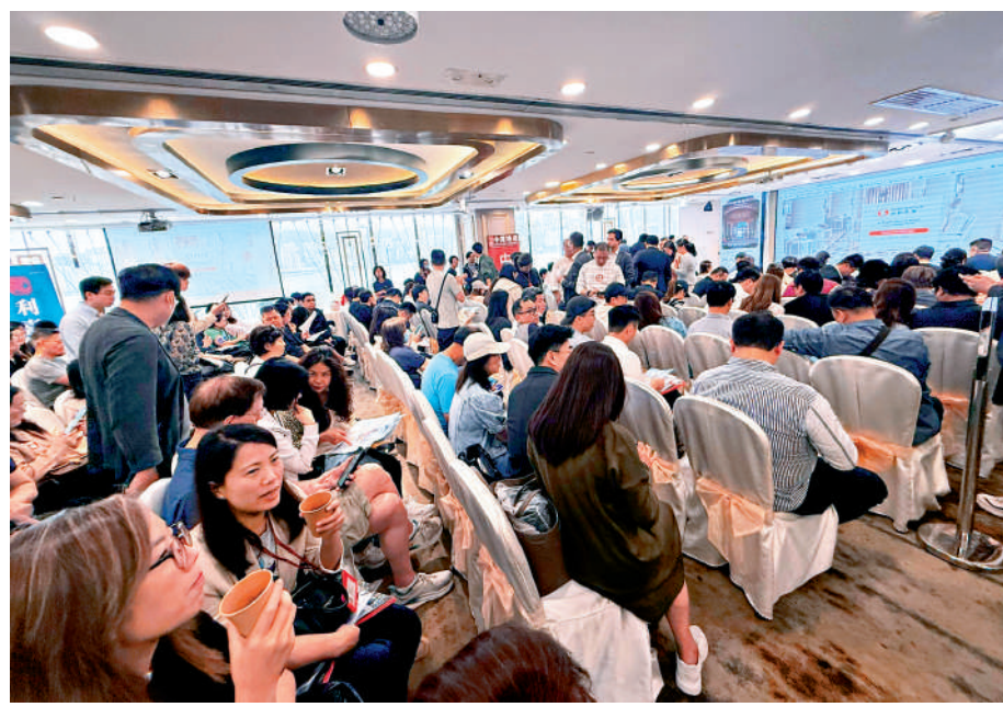
▲海堤灣 I 昨日次輪價單推售168伙，氣氛依然熱鬧。

今年最大規模盤、信置(00083)牽頭的日出康城海堤灣I，昨日於長假期最後一日進行次輪銷售，其中168伙以價單形式推售，發展商公布，即日沽出152伙或90%。該盤帶動下，一連5天復活節長假期一手錄逾310宗成交，本月首周交投量則逾420宗，較上月同期增約三成，海堤灣I月內共沽159伙，暫為期內銷售王。 該盤於3月31日進行首輪價單開售254伙，即日沽清，發展商復於昨日次輪以價單發售168伙，由於向隅客眾多，昨日場面依然熱鬧。買家於9時開始魚貫到場，排隊人龍由室內排到室外，由帝國中心排到對開花園，保持首輪銷售的熱度。