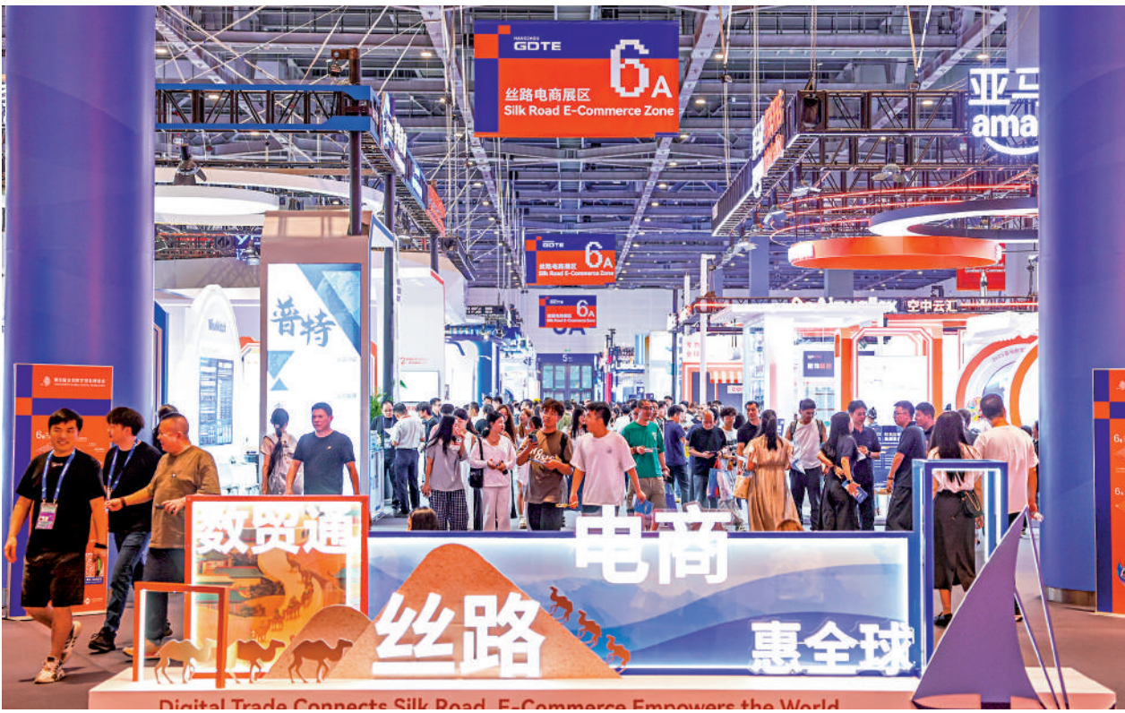
▲傳統轉口貿易增長放緩，香港需要培育新的增長動能，而數字貿易、跨境電商、供應鏈服務等正是值得發力的重要方向。參與「絲路電商」戰略，將為香港打開新的發展空間。