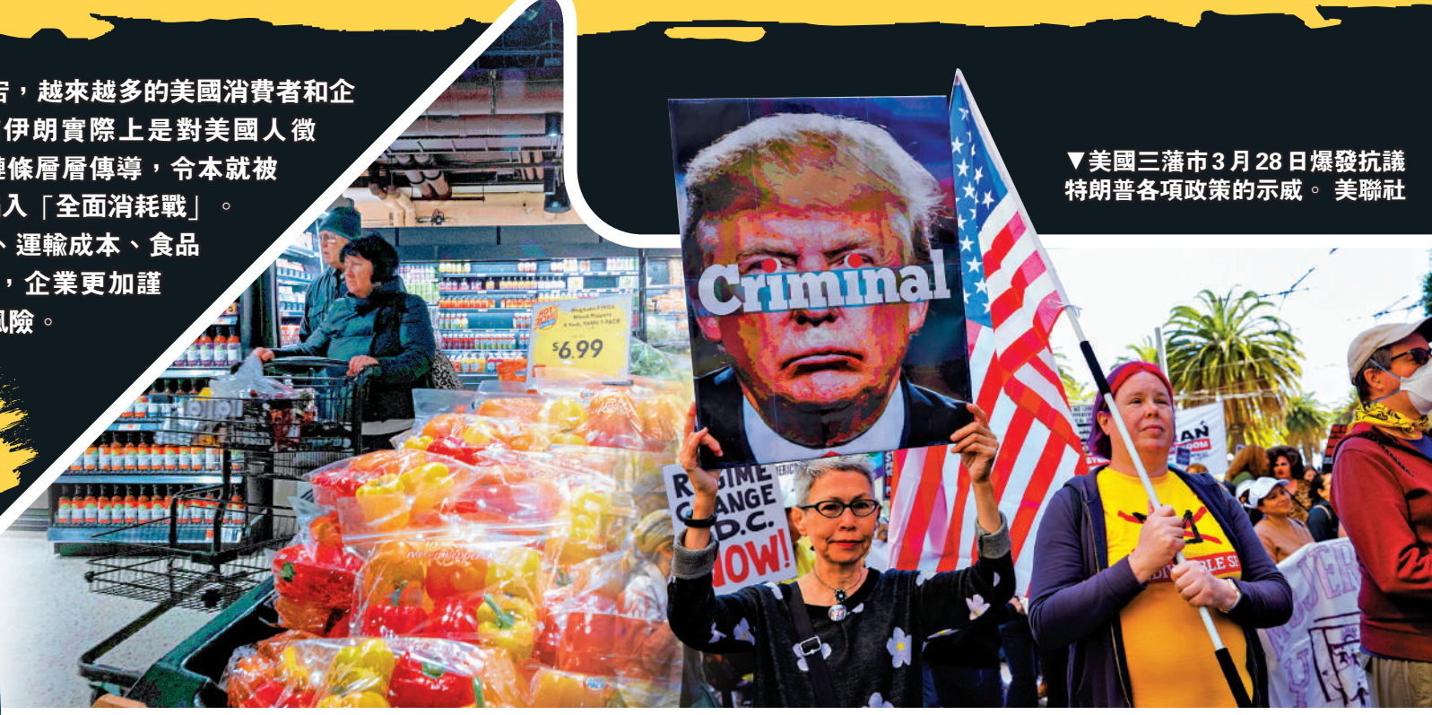
▲美國三藩市3月28日爆發抗議特朗普各項政策的示威。