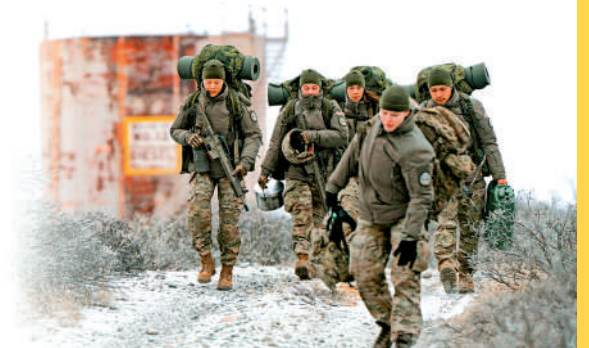
▲丹麥士兵2月20日在格陵蘭島參加訓練。

近日，日本首相高市早苗表態稱，想就中東局勢和能源問題與美國、伊朗領導人分別舉行會談。伊朗駐日本大使館7日在X平台上發文質問日本，「一個簡單的問題：如果你不要求侵略政權緩和局勢，而只是敦促受害方這樣做，這實際上豈不是要求受害方停止自衛嗎？」