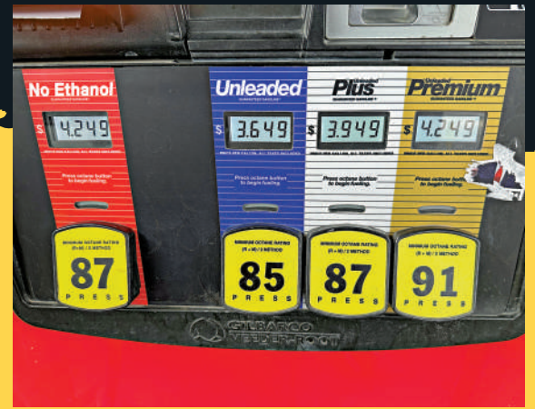
▲美以衝突爆發以來，美國油價持續上漲。

美以衝突導致中東石油出口受阻，全球能源價格飆升，美國油價也升至2022年以來的峰值。油價上漲推高整體經濟運行成本，美國航空運營商、物流運營商等紛紛上調燃油附加費。美國農業部近期預測，食品價格可能也將上漲約3.6%。經合組織已將對2026年美國通脹率的預測從3%上調至4.2%。大公報整理