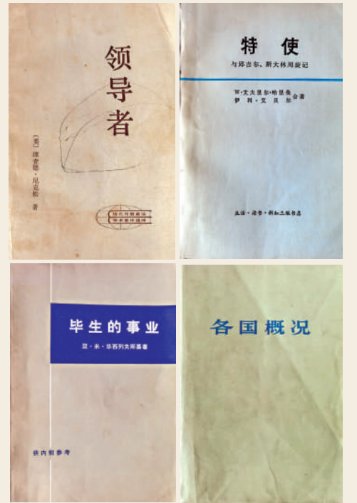
▲《領導者》，理查德·尼克松著（左上）；《特使》，W·艾夫里爾·哈里曼、伊利·艾貝爾合著（右上）；《畢生的事業》，亞·米·華西列夫斯基著（左下）；《各國概況》（右下）。

讀史知興替，溫故而知新。常言道：史家面前無新聞，世間的一切似乎都只是歷史的輪迴。我慶幸無意中收藏了這些「內部版」的珍本，就好像集郵家收藏到某一張珍稀的錯版郵票。然而，就其認識價值和史料價值而言，這些書中所收藏的，又豈是錯版郵票所能比擬的呢？這是一個特殊時代的「鱗片」。