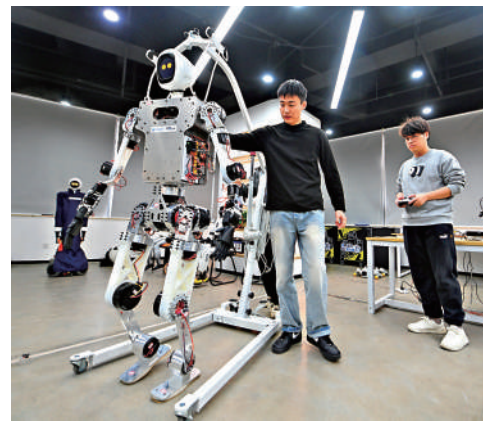
▲7日至8日，全國服務業大會在北京召開。會上傳達了中共中央總書記、國家主席、中央軍委主席習近平重要指示。中共中央政治局常委、國務院總理李強出席會議並講話，中共中央政治局常委、國務院副總理丁薛祥作總結講話。

吳政隆出席會議。會議以電視電話會議形式召開。各省、自治區、直轄市和計劃單列市、新疆生產建設兵團，中央和國家機關有關部門、有關人民團體，中央管理的金融機構、部分中央企業，中央軍委機關有關部門負責同志等參加會議。