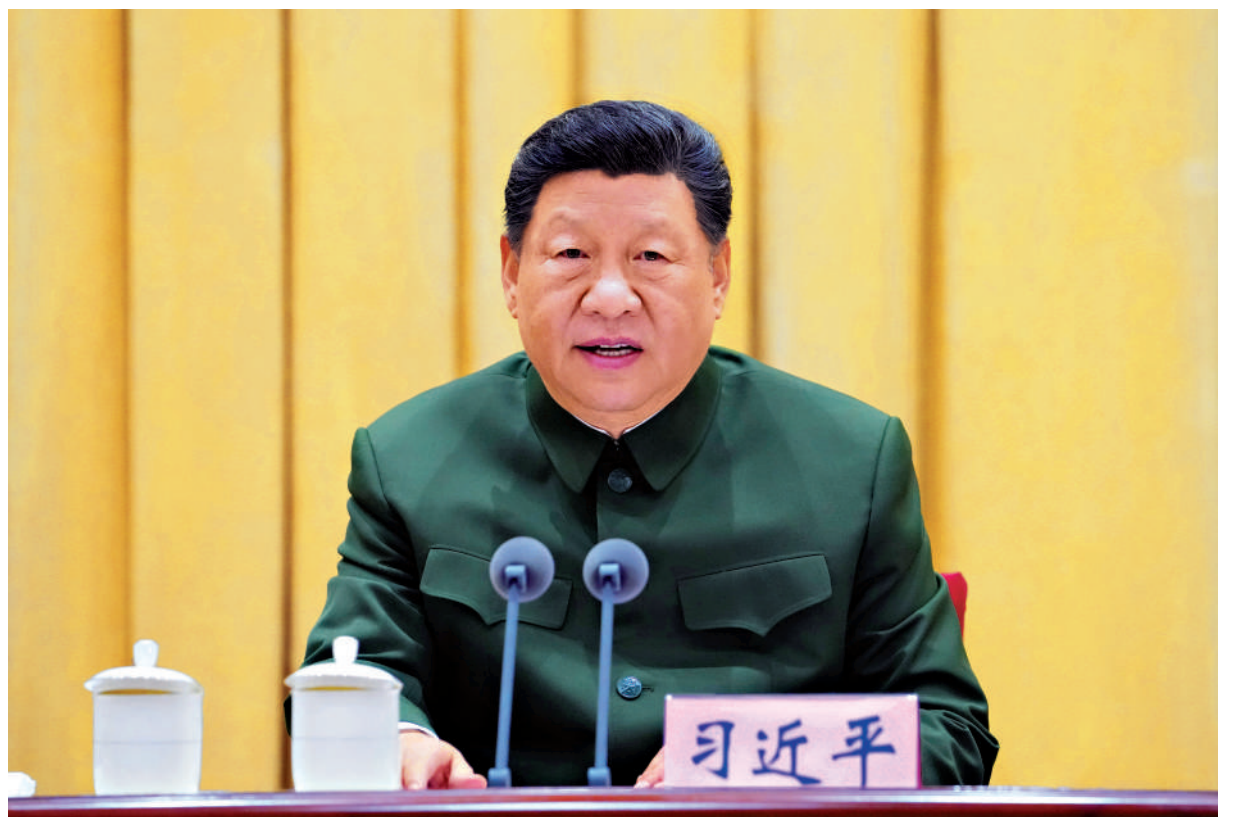
▲8日上午，全軍高級幹部培訓班在國防大學開班。中共中央總書記、國家主席、中央軍委主席習近平出席開班式並發表重要講話。

中央軍委副主長張升民主持開班式。第一期全軍高級幹部培訓班學員，軍委機關各部門、軍隊駐京有關單位主要負責同志等參加。開班式以電視電話會議形式組織，在全軍相關軍級以上單位設分會場。