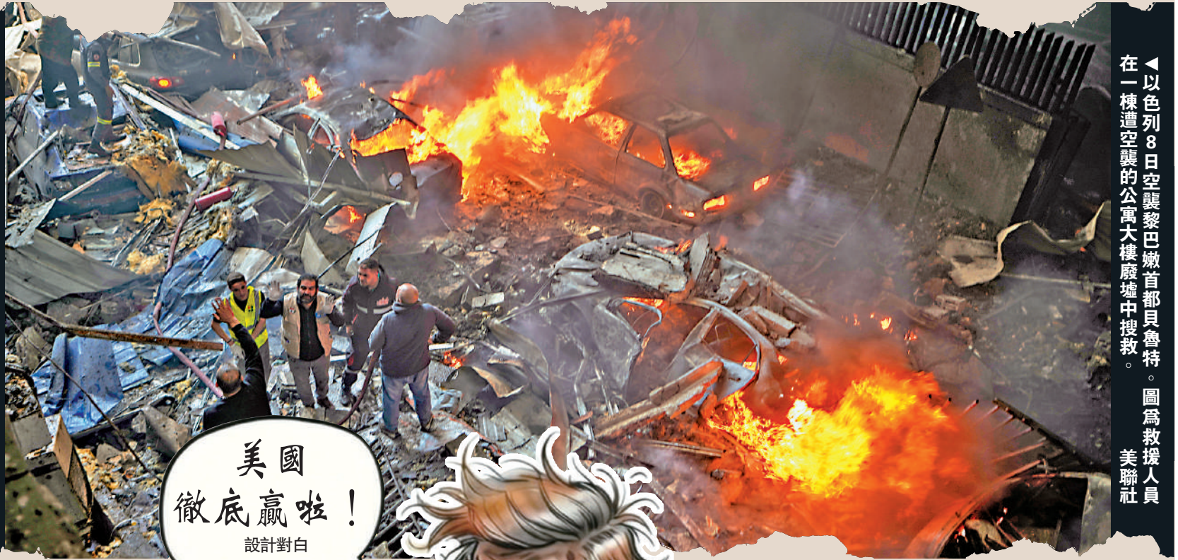
以色列8日空襲黎巴嫩首都貝魯特，在一棟遭空襲的公寓大樓廢墟中搜救。圖為救援人員