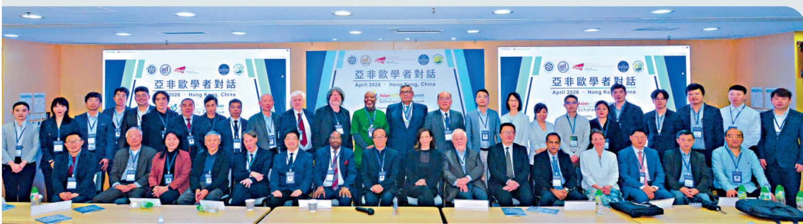
▲為期兩日的「亞非歐學者對話」國際學術會議在香港城市大學舉行。