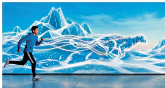
▲舞台表演之外，觀眾亦可踏入展覽空間與雪山動物「賽跑」。

被放置在舞台中央，四周與上方同時發生表演。「如果大家坐在中間，很自然會抬頭看。」他說，因此加入大量空中元素與鋼絲特技，讓觀看不再局限於平面。在排練現場，林俊浩邀請記者先坐在椅子上觀察前半部分，再走到排練廳對面、觀看需登上高台的段落，讓觀眾在其中的存在感被放大。「我們想改變的，不只是內容，還有觀看的方式。」