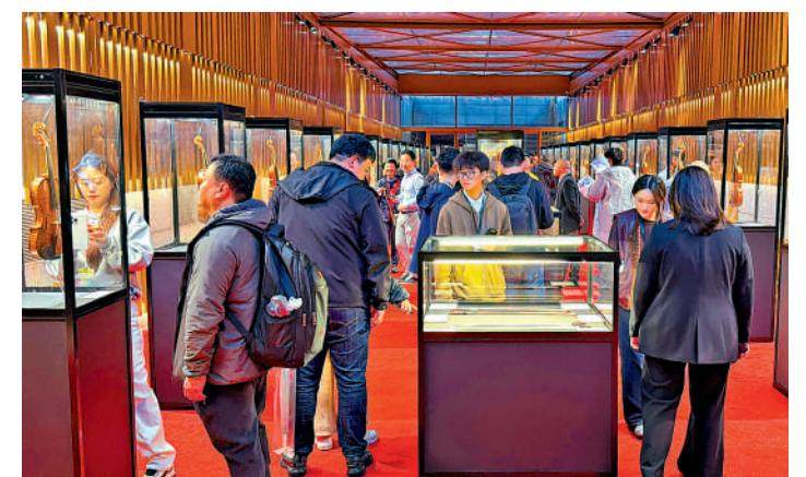
▲「中外名琴藝術典藏展」吸引了大量樂器迷前來觀展。

此外，捷豹上海交響音樂廳的葡萄藤長廊將化身「生活間奏市集」，融合小型樂器、手工文創、音樂周邊與潮流輕食等特色品類，在夜間持續開放，以繽紛業態點亮城市夜空，激發夜間經濟新活力，讓「音樂+生活方式」的理念融入城市日常。