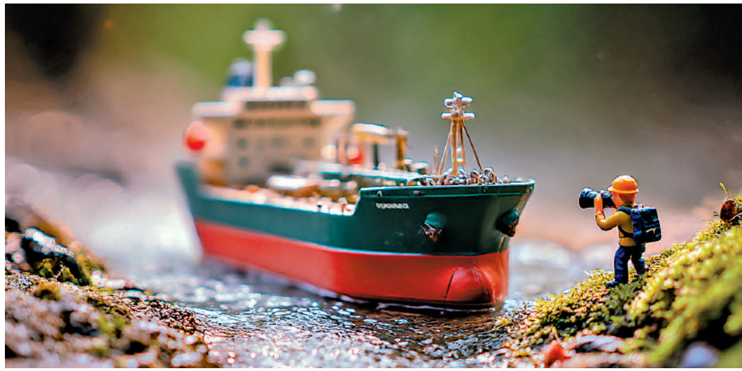
▲Citrini分析師日前實地考察霍爾木茲海峽，為投資者帶來一手信息。