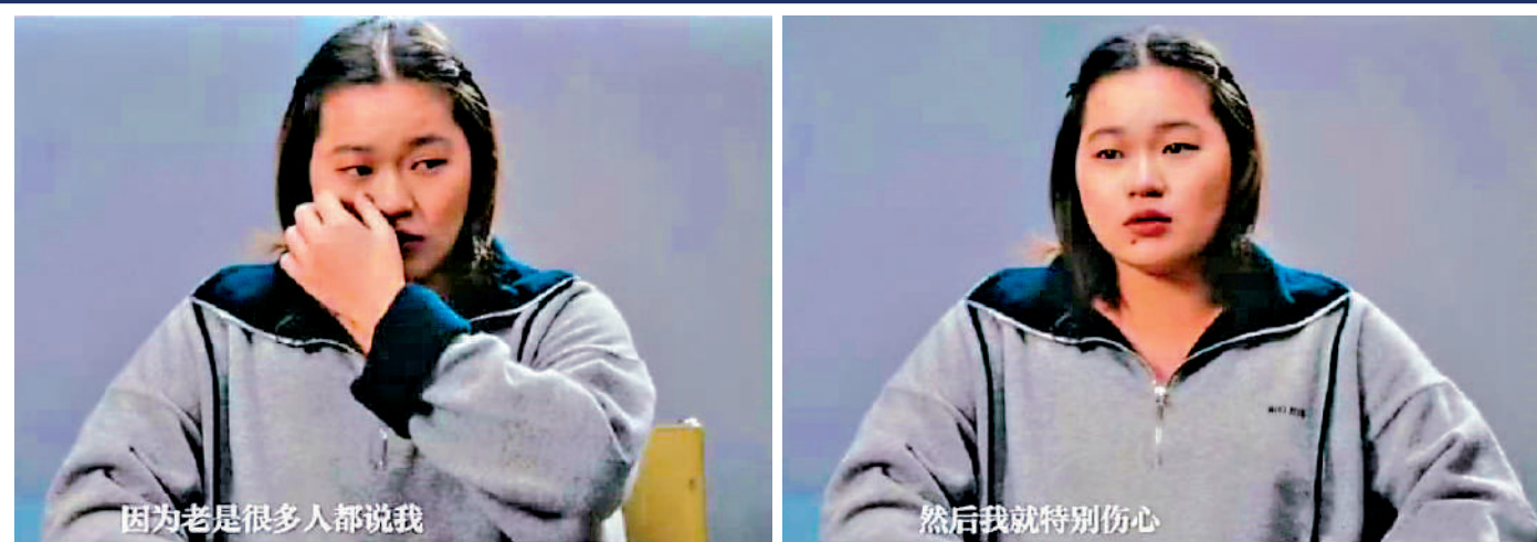
▲全紅嬋日前在接受媒體訪問時曾激動落淚,這一幕讓不少人感到唏噓。

4月9日,《檢察日報》刊發文章《全紅嬋遭網暴已報警,法治社會容不下無端「鍵盤傷人」》,就中國國家隊跳水運動員全紅嬋遭受網絡暴力一事作出評論,明確指出網暴行為的違法性,呼籲以法治守護清朗網絡空間。據媒體報道,此次全紅嬋遭網暴事件,疑似與一個規模達200餘人的微信群有關。