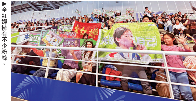
▲全紅嬋擁有一些不少粉絲。

根據上述規定,群主對群成員負有管理職責。若調查證實該微信群的群成員發表不當言論侵犯他人合法權益或公共利益的,群主若未盡管理職責,亦應承擔相應侵權責任,若情節嚴重,還可能面臨治安處罰甚至刑事責任。