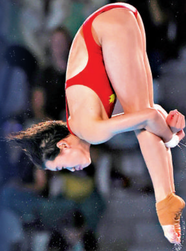
▲全紅嬋是中國跳水隊名將。

文章提及,4月8日,全紅嬋所屬的廣東省二沙體育訓練中心就其遭網暴一事發文,明確表示已報警,並將通過法律途徑堅決追究網暴者的相關責任。隨後,國家體育總局游泳運動管理中心也發表聲明,表態堅決支持通過法律手段維護運動員合法權益,堅決抵制畸形「飯圈」文化對體育圈的侵蝕。此前,全紅嬋在接受媒體採訪