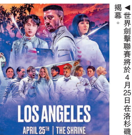
▲世界劍擊聯賽將於4月25日在洛杉磯揭幕。

其餘獲邀參賽的還有兩名女子花劍選手,包括奧運會3金得主、美國的姬花及意大利的阿里安娜。另外,佩劍有韓國的奧運3金得主吳尚旭,重劍則有日本的奧運兩金得主加納虹輝。