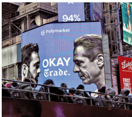
▲Polymarket在紐約市投放廣告。

● 特朗普未知會北約盟國便挑起與伊朗的戰爭，隨後又試圖拉盟國下水，但英國、法國、德國、意大利、西班牙等國均與美國的軍事行動保持距離，包括限制美軍使用本國基地、拒絕參與霍爾木茲海峽「護航」、公開批評特朗普挑起戰爭等。大公報整理