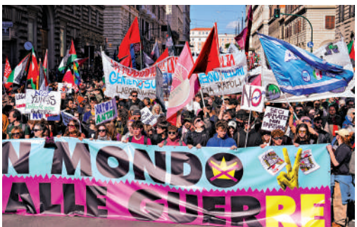
▲意大利民眾3月28日參加示威，抗議美國挑起與伊朗的戰爭。

美國在歐洲駐紮着約8.4萬名士兵，主要分布在德國、意大利、波蘭、英國等地，具體人數會因軍事演習和輪換部署有所變化。暫不清楚哪些國家的美國駐軍會被調走，但近期多個盟國與特朗普發生過衝突。西班牙是唯一一個堅持拒絕將軍費佔GDP比例提升至5%的北約成員國，在美以衝突期間拒絕