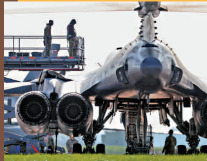
▲美軍3月21日使用在英國的軍事基地進行對伊朗軍事行動。

● 特朗普重返白宮後強行索要北約成員國丹麥的自治領地格陵蘭島，甚至威脅派兵奪島，引發歐洲盟國強烈反對。他日前聲稱正在考慮退出北約，根本原因就是索要格陵蘭島遭拒。