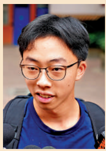
▲劉同學選擇「大自然」一題,認為貼近生活,用生活經驗即可寫出。

DSE中文科昨日開考,有考生認為今年題目較去年容易,命題作文題目貼近生活、有更多發揮空間,但實用文部分考評文章令人意外,亦有同學認為發揮不佳,遇到「信心問題」。