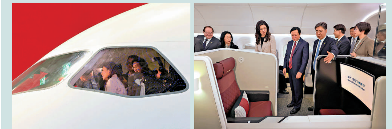
▲中國國民黨主席鄭麗文9日登上C919樣機客艙後表示「很寬敞」。