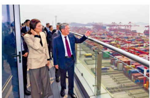
▲中國國民黨主席鄭麗文（左）一行9日參訪上海洋山港。

鄭麗文指出，大陸全面推進鄉村振興戰略，推動農業農村的現代化。台商可以把台灣的休閒農業、農產品深加工、地方創新的成功經驗引入大陸。此外，從高階金融理財品牌文創、餐飲連鎖到物業管理，只要把台灣「以人為本」的精緻服務理念帶出來，結合大陸市場數字化支付和物流的優勢，台資的服務業在「十五五」期間相信也能夠迎來新的黃金發展期。