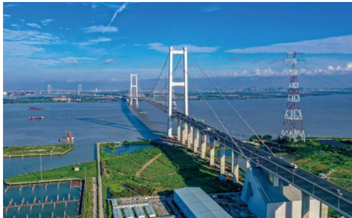
▲郵儲銀行遼寧省分行專項貸款精準支持當地「老字號」裝備製造企業創新發展。

同時，郵儲銀行將做好資產負債結構優化、資本質效提升、收入質量提升、成本管控提升、客戶經營提升、風控能力提升等，持續抓好防風險、調結構、促改革、強治理四件事，實現新發展模式的開好局、起好步。