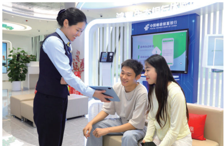
▲客戶在郵儲銀行體驗鴻蒙生態銀行。

在零售金融領域，郵儲銀行穩扎穩打，夯實零售戰略地位。截至2025年末，郵儲銀行管理個人客戶資產（AUM）規模突破18萬億元，較上年末增長9.64%。