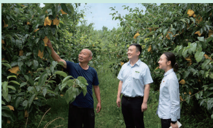
▲郵儲銀行客戶經理走訪酥梨種植戶。