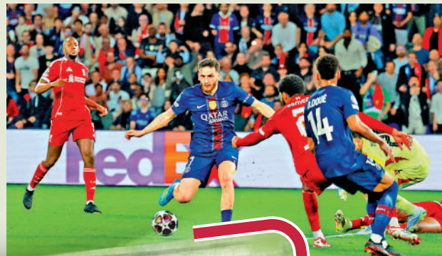
▲基華拉斯基利亞(左二)攻破利物浦大門。