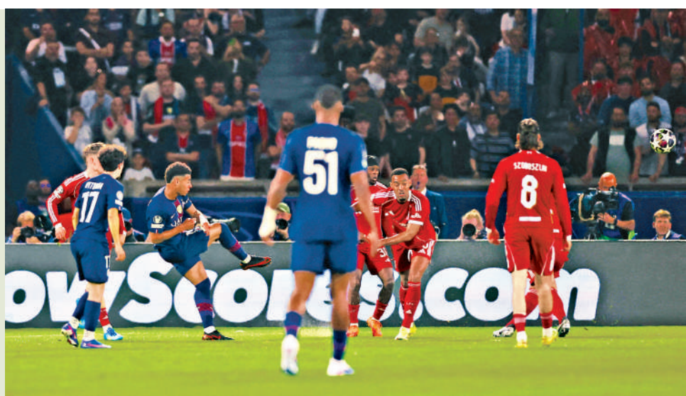
▲迪斯亞杜伊(左三)替聖日耳門先開紀錄。