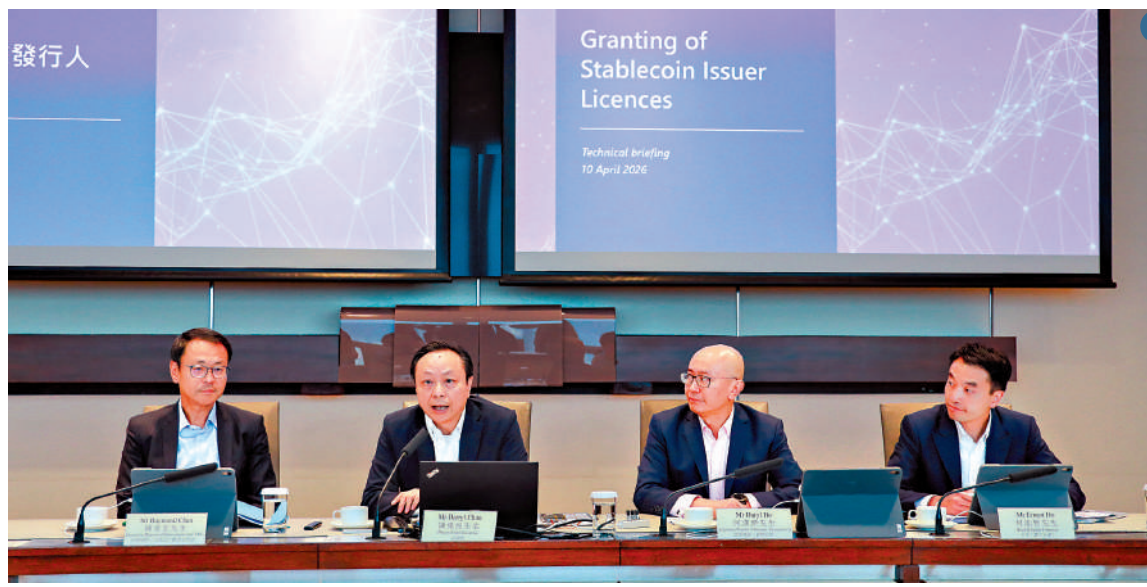
▲金管局管理層出席穩定幣記者會。