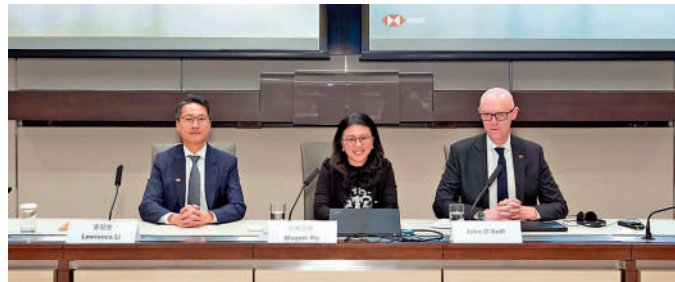
▲滙豐計劃下半年推出港元穩定幣。

余偉文中重申，考慮到發行業務所涉及的風險、對用戶的保障，以及市場的承載力和長遠發展，發牌設有相當高的門檻，即使將來再發牌照，「整體牌照數量也會很有限」。兩個牌照在落地後營運的成效和市場的反應，也有助金管局作出較全面的評估。