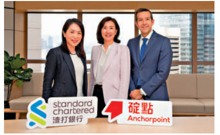
▲碇點金融預計，今季起分階段發行港元穩定幣。