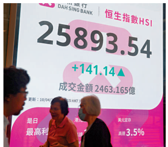
▲恒指昨日曾升321點，收市升幅縮窄至141點。

摩通表示，MSCI中國指數、滬深300指數將受惠於中國宏觀經濟韌性，並且政府資金作後盾。摩通維持MSCI中國指數、滬深300指數今年底基本目標100點及5200點，首選包括比亞迪（01211）、MiniMax（00100）、智譜（02513）、中國銀行（03988）、信達生物（01801）及中海油（00883）等股份。MSCI中國指數周四收報78.97點，跌0.7點。滬深300指數昨日收報4636點，升70點。