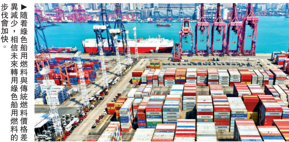
異步減少，相信未來轉用綠色船用燃料的步代會加快。