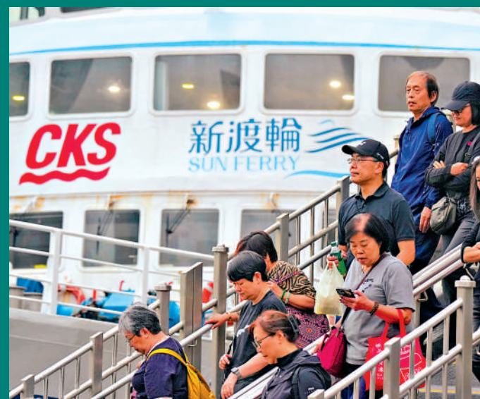
立法會財委會昨日通過柴油補貼18億元撥款申請，以支援運輸業界應對油價急升困境。