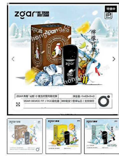
▲電子煙售賣網站內，煙機、煙彈、一次性電子煙等產品一應俱全，並無任何遮掩。

規定，任何人不得進口另類吸煙產品（包括電子煙、加熱煙及草本煙），「進口」行為包括以包裹及貨物形式進口，或者個人攜帶入境。立法會於去年9月通過《2025年控煙法例（修訂）條例》，以推動「控煙十招」，多項措施正分階段落實，其中包括由本月30日起，任何人不得在公眾地方管有另類吸煙產品，包括電子煙、加熱煙及草本煙。