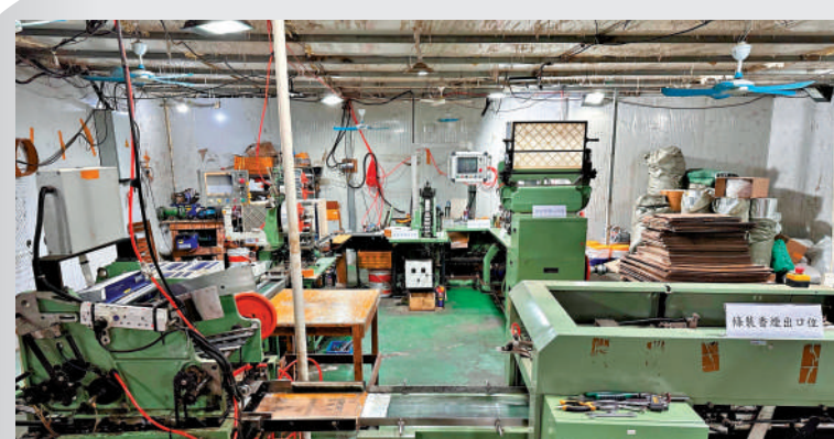
▲海關近日在粉嶺坪峯搗破大型的地下私煙製作工場。

立法會議員管浩鳴表示，海外許多國家和地區沒有管控電子煙，因此在境外向香港售賣電子煙可能不違反當地法律，除非賣方就在香港，否則追究有難度。他提醒消費者不要明知故犯，例如知道香港不可進口另類吸煙產品，卻隱瞞海關帶電子煙入境。