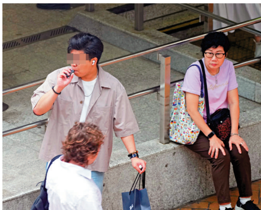
▲本月30日起，任何人不得在公眾地方管有電子煙煙彈、煙油、加熱煙和草本煙。