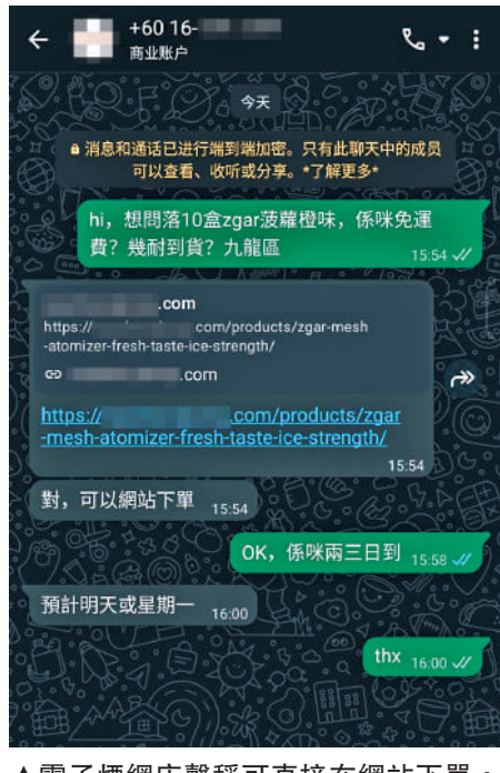
▲電子煙網店聲稱可直接在網站下單，到貨日期「預計明日或星期一」。