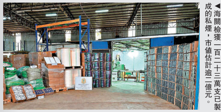
▲海關檢獲一百二十三萬支已製成的私煙，市值估計逾一億元。

海關對判刑表示歡迎，認為反映即使旅客屬初犯，亦可能被判處監禁，而刑罰具阻嚇作用，並反映罪行的嚴重性，市民切勿以身試法。海關提醒市民，根據《條例》，香煙屬應課稅品。任何人士若進口、處理、管有、售賣或購買私煙，即屬違法，一經定罪，最高可被判罰款200萬元及監禁7年。