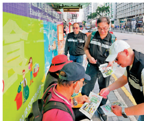
▲圖為控煙酒辦人員於尖沙咀一巴士站向市民派發有關控煙措施的宣傳單張。