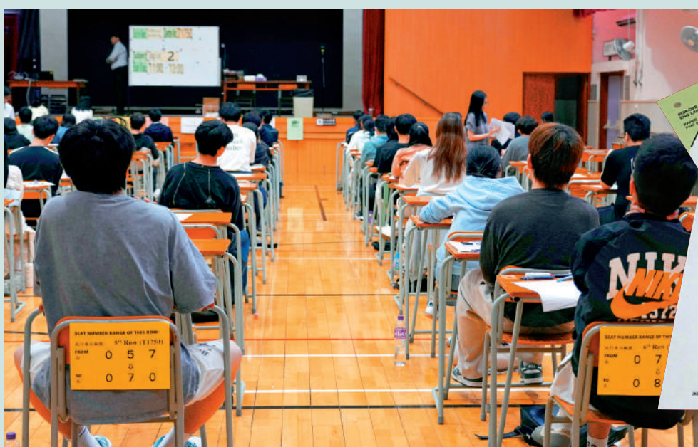
▲DSE 英文科閱讀和寫作卷考試昨日舉行，逾5.2萬名學生報考。