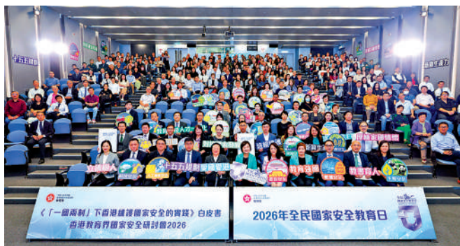
▲教育局主辦教育界國家安全研討會，與業界深入研讀《「一國兩制」下香港維護國家安全的實踐》白皮書。

互相配合」的方式，通過提供課程指引、製作學與教資源、舉辦教師培訓、組織學生全方位學習活動等，全面支援學校有系統地規劃和推行國民及國家安全教育。教師肩負培育學生正確價值觀及國民身份認同的重任。配合白皮書的推出，局方將開發多元化的教材，供老師參考使用。