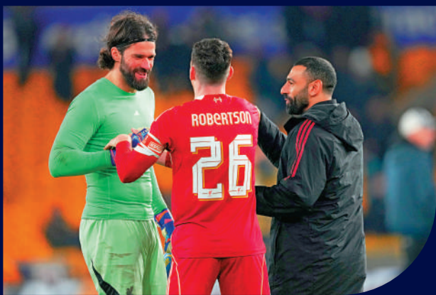
▲羅拔臣（中）與沙拿（右）將於今年夏天離開利物浦。