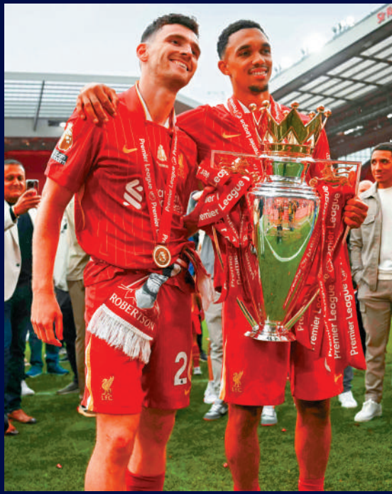
▲羅拔臣（左）曾替利物浦立下不少汗馬功勞。