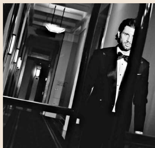
▲高大英俊的外形，令蘇保斯拉爾深受時尚品牌的垂青。

去年底，他為家鄉一間國際知名連鎖酒店拍攝宣傳片，散發出高雅紳士的男人味。當然，他效力的利物浦也有不少服裝品牌合作夥伴，蘇保斯拉爾自然也成為首選模特兒。今季球隊球衣轉換贊助商，蘇保斯拉爾當然也是重要賣點。另外，他至今仍是母會紅牛集團的代言人。