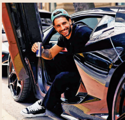
▲除了電子遊戲，蘇保斯拉爾亦對名車深感興趣。

蘇保斯拉爾亦愛收藏高檔腕錶，之前就被拍到佩戴了一隻價值約7萬英鎊的世界聞名品牌勞力士星期日曆型白金鑽戒腕錶。他亦對名車情有獨鍾，據報他每當到職業生涯一個重要的里程碑，例如加盟RB萊比錫和利物浦時，他都會購買一輛汽車獎勵自己。他亦有飼養小狗，不時在休息時候陪伴愛犬玩樂。