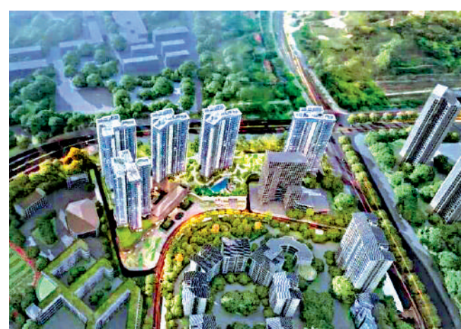
◀中海雲頌玖章以低密度規劃及高端定位，受到買家注視。

中海雲頌玖章是中海地產「玖章」在深圳的第三個項目，地處梅林關門戶核心，規劃為5幢23至25層高住宅，提供491伙，預計5月開放營銷中心和示範單位，6月開盤。憑藉核心地段、低密度規劃及高端定位，成為龍華區受關注的改善型住宅。