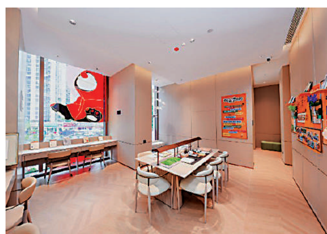
◀聯發新澍雅居以小戶型為主，單位面積由69平米起。

聯發新澍雅居為龍華區民治街道的純商品房新盤，地處龍華數字經濟核心區，依託深圳北站國際商務區，周邊已形成超百家數字經濟企業，產業支撐強勁。項目坐擁雙地鐵優勢，距4號線塘上站約800米、6號線芬芬站約650米，一站直達深圳北站換乘高鐵。