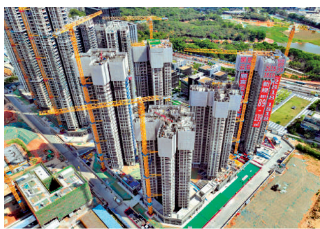
◀鵬宸雲築共12幢物業，目前正在施工階段，預計明年交樓。

龍華區民治街道新盤鵬宸雲築11號樓獲預售許可證，預計短期內開售。本次加推252伙，備案每平米均價約6.14萬元（人民幣，下同），折後均價約5.34萬元（約6.1萬港元）。入門級的89平米戶型入場費約440萬元起，103平米戶型由約531萬元起。