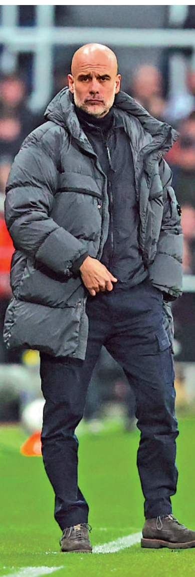
▲曼城領隊哥迪奧拿。