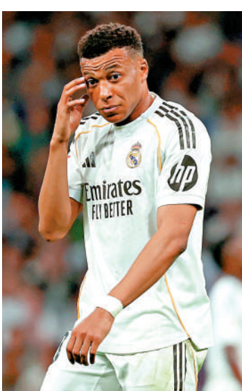
▲麥巴比破門乏力。

艾比路亞賽後不滿麥巴比在完場前個人突破至小禁區，被對手打至流血仍未獲得十二碼，他質疑VAR為何不介入。