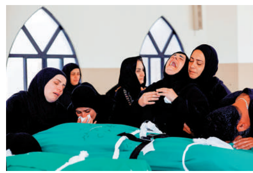
黎巴嫩民眾12日悼念死於空襲的親人。

據黎巴嫩媒體報導，11日晚至12日凌晨，以色列對黎南部多地發動空襲，造成至少24人死亡、多人受傷。黎巴嫩駐美大使、以色列駐美大使及美國駐黎巴嫩大使計劃於14日在美國舉行三方會晤，討論以黎停火談判事宜。薩拉姆原計劃16日與美國國務卿魯比奧會面，但他11日表示，鑒於當前黎巴嫩國內形勢，為充分履行維護黎巴嫩人民安全和團結的職責，將推遲前往聯合國和美國的行程。