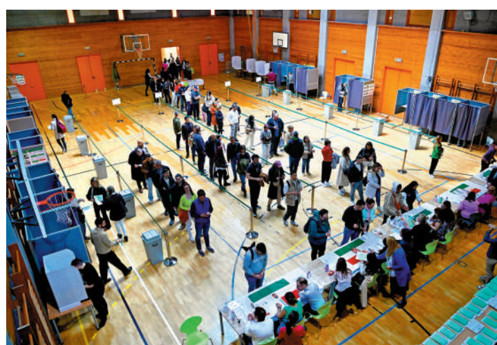
匈牙利選民12日布達佩斯排隊投票。

選舉前夕，歐洲媒體曝光匈牙利與俄羅斯兩國外長通話內容，質疑匈牙利洩露敏感信息，俄方則指責歐盟「偷聽」。