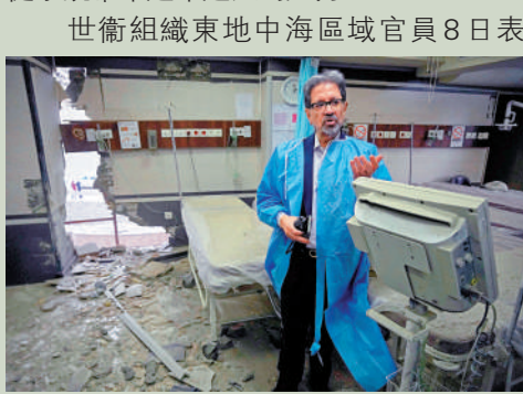
▲伊朗德黑蘭甘地醫院遭到美以炮彈襲擊，病房設施嚴重受損。

【大公報訊】綜合報道：聯合國世界衛生組織警告，美以針對伊朗軍事和民用目標的持續空襲，正給伊朗脆弱的醫療保健系統帶來越來越大的壓力。