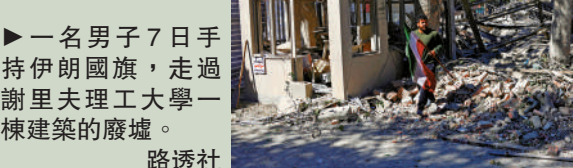
▲一名男子7日手持伊朗國旗，走過謝里夫理工大學一棟建築的廢墟。

伊朗實行9年免費義務教育，公立高中亦提供免費教育。截至2016年，伊朗成年人口的識字率約為94%，15至24歲青年的識字率高達97%，居中東國家前列。2013年，沙特15歲以上人口的識字率約為94%。