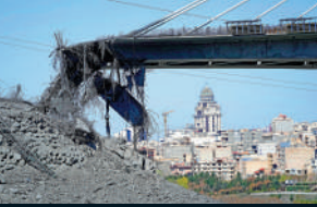
▲伊朗貝伊克公路橋2日遭遇美軍多輪空襲。

4月2日，遭遇美軍的多輪空襲後，位於伊朗卡拉季市的貝伊克公路橋主體結構嚴重受損，橋面坍塌。這座被稱為「中東最高橋樑」的貝伊克公路橋，是伊朗首都德黑蘭到西部城市卡拉季交通走廊的核心樞紐。