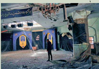
▲一名學生正在查看謝里夫理工大學清真寺的受損情況。

聯合國憲章禁止成員國對他國使用武力第2條第4款(禁止使用武力)和第51條(自衛權的限制)。第51條的自衛權，僅限於本國遭受「即時威脅」和構成緊急狀態，美國以伊朗核設施為由出兵，根本無法以自衛為由辯護。