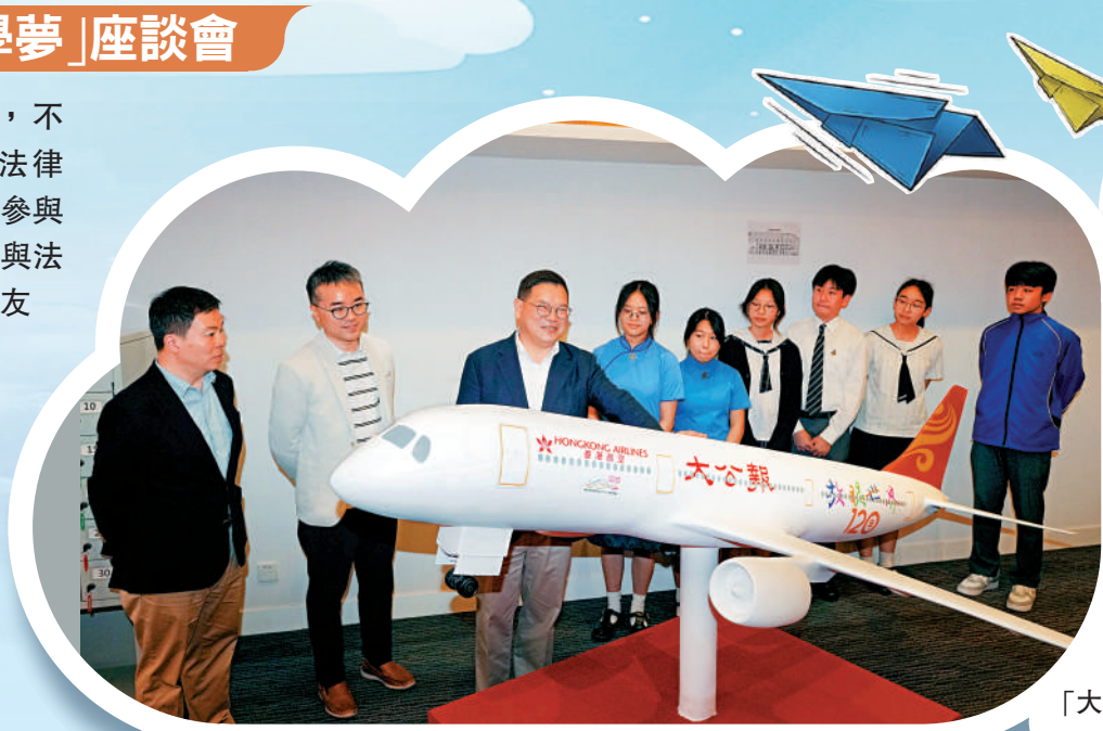
▲嘉賓與同學們與「大公報」號飛機模型合照。