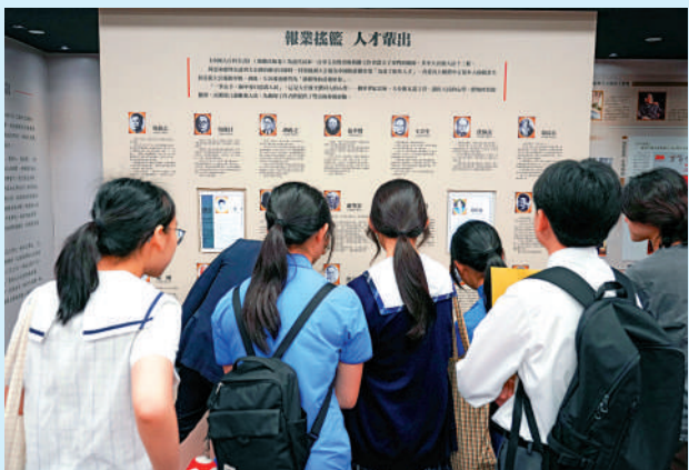
▲同學們對大公報歷史甚感興趣，聚精會神閱讀資料。