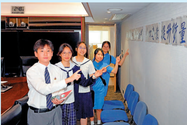
▲同學們參觀大公報編輯部。

示，雙學位的收生標準通常更嚴格，能申請到這類課程的學生都比較優秀。這類課程有一個好處，是將技術性學科和人文學科結合，其實人文學科很多時候是訓練批判思考的，而技術性學科側重實際技能，若能將兩者結合起來，便不用擔心被AI取代。