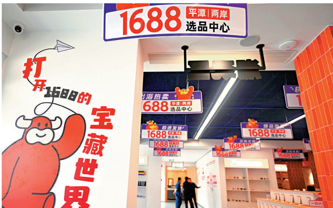
位於福建平潭的「1688平潭兩岸選品中心」人氣持續高漲。這裏正成為兩岸經貿融合、台灣青年創業就業的新熱土，為兩岸商品互通、產業互聯搭建起高效暢通的便捷橋樑。

就此次十項「和平利好」發布，台立法機構中國國民黨黨團總召集人傅崐萁分析指出，安定生活與經濟發展是台灣百工百業、全體民眾最真實的期待。當大陸釋出善意並提出具體政策時，台當局應規劃相關配套，讓利好政策落地，轉化為民眾看得見的成果。