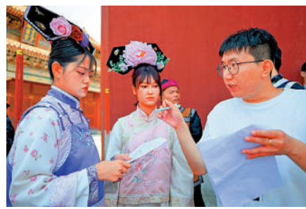
大陸支持台灣業者參與大陸微短劇創作。圖為台灣青年在浙江橫店影視城感受古裝微短劇拍攝。資料圖片

【大公報訊】記者蘇榕蓉報導：中共中央台辦十項惠台新措中，明確提出允許引進導向正確、內容健康、製作精良的台灣電視劇、紀錄片、動畫片在大陸衛視頻道和網絡視聽平台播出，並支持台灣業者以多種方式參與大陸微短劇創作。此舉在台灣影視