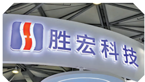
▲勝宏科技昨日起招股，集資額約175億元，散戶入場費約21200元。