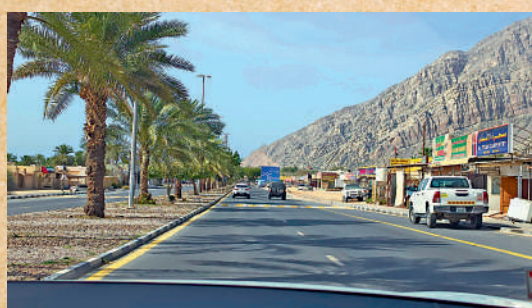
▲拉斯海瑪的位置在阿聯酋的最北邊，大公報記者前往當地直擊美軍封鎖霍爾木茲海峽一刻。

至香港時間晚上10時40分左右，大公報記者聽到第一輪炮響，未知是哪一方發動攻擊，