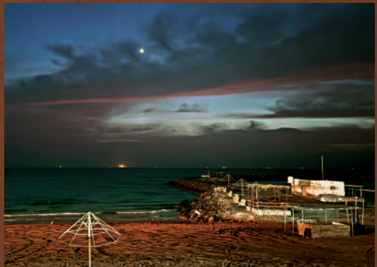
▲香港時間昨晚11時，海上傳來第二次炮火聲，多艘船隻在漆黑的海上繼續等候。