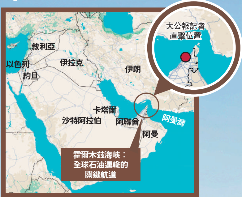
▶有船隻由阿曼灣進入霍爾木茲海峽，禁令開始後，便下錨停泊，不敢輕舉妄動。