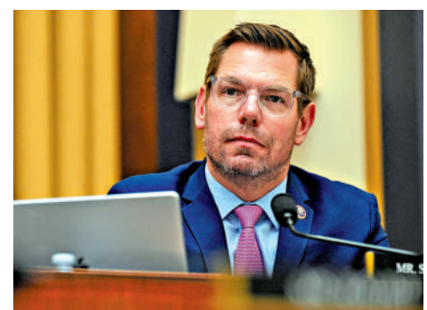
▲斯沃韋爾去年9月在國會出席聽證會。

4月初的民調顯示，56歲的共和黨候選人希爾頓以22%的支持率排在第一，斯沃韋爾以18%排在第二。現任加州民主黨籍州長紐森的任期將於明年1月屆滿。