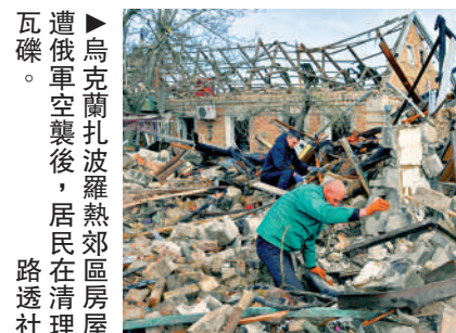
▲烏克蘭空襲後，居民在清理房屋瓦礫。

新政府將改善與烏克蘭的關係列入議程，此前歐爾班政府阻撓的歐盟900億元援烏貸款或將快速落地。不過，匈牙利的政權更迭不會改變烏克蘭戰爭的根本格局，毛焦爾在競選中多次表示，匈牙利不會直接向烏克蘭提供武器或資金。