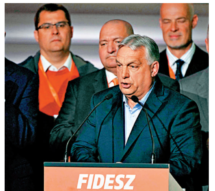
▲匈牙利總理歐爾班12日敗選後向支持者發表講話。