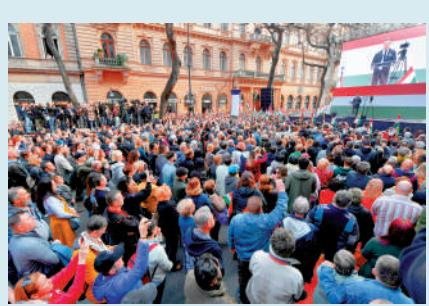
▲2024年3月，匈牙利民眾在布達佩斯舉行反政府示威，毛焦爾在台上講話。

【大公報訊】綜合《衛報》、BBC報道：帶領蒂薩黨結束歐爾班16年執政的毛焦爾，並非傳統反對派的老面孔，而是憑藉「體制內反對派」的獨特身份，在短短一年多的時間裏崛起。他從昔日歐爾班的追隨者變成歐爾班時代的終結者，其個人經歷備受關注。