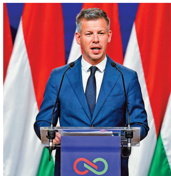
▲蒂薩黨黨魁毛焦爾13日在布達佩斯向媒體發表講話。