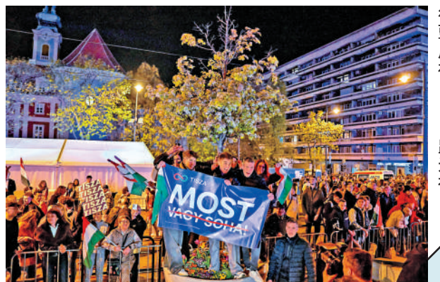
▲議會選舉結果公布後，蒂薩黨的支持者在布達佩斯街頭慶祝。